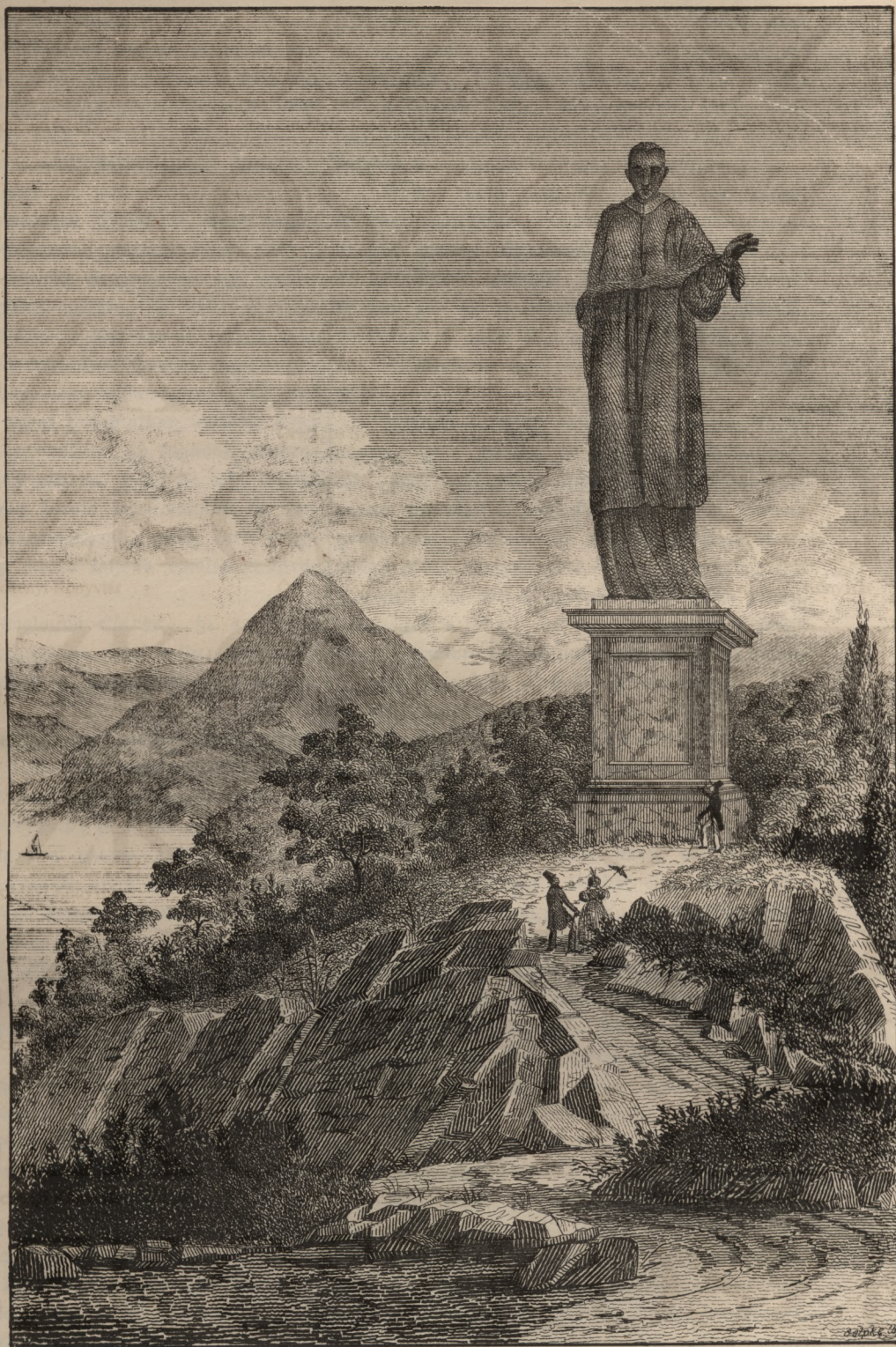
S. Borromeus saronna.