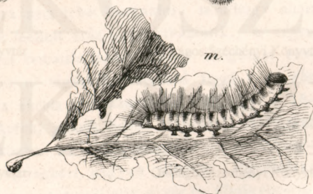
Arctalmas erdei pillangók.