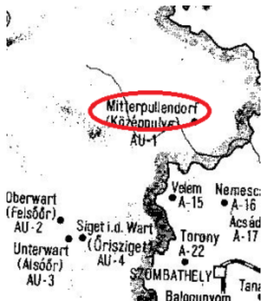
1. térkép. Az ausztriai őshonos magyar települések az MNyA. térképe alapján

Felsőpulya a négy burgenlandi nyelvátlasz-kutatópont egyike (l. 1. térkép), az őshonos határőrvidék része a magyarság Kárpát-medencei megjelenésétől kezdve. A Trianon utáni békediktátum pecsételte meg a sorsát, de azóta több olyan további történelmi esemény is bekövetkezett, amelyek közvetetten hatással voltak a település nyelvhasználatára. A második világháborút követően Magyarország szovjet megszállása (bár Burgenland szovjet zóna volt) a kapcsolatok megszakadását eredményezte, amelyet a hidegháború még fokozott. Az osztrák államszerződésben előírták Ausztriának a területén élő kisebbségek jogainak tiszteletben tartását, de a kisebbségek benne foglalt felsorolásából a magyarokat és a cigányokat „kifelejtették”. 1975-ben a település szerkezetében és szerepében fontos változás következett be: Közép- és Felsőpulya összevonását és városi rangra emelését követően járási székhellyé válva a történelmileg jelentősebb magyarlakta középpulyai részről az inkább németek által lakott városrész vette át a vezető szerepet.