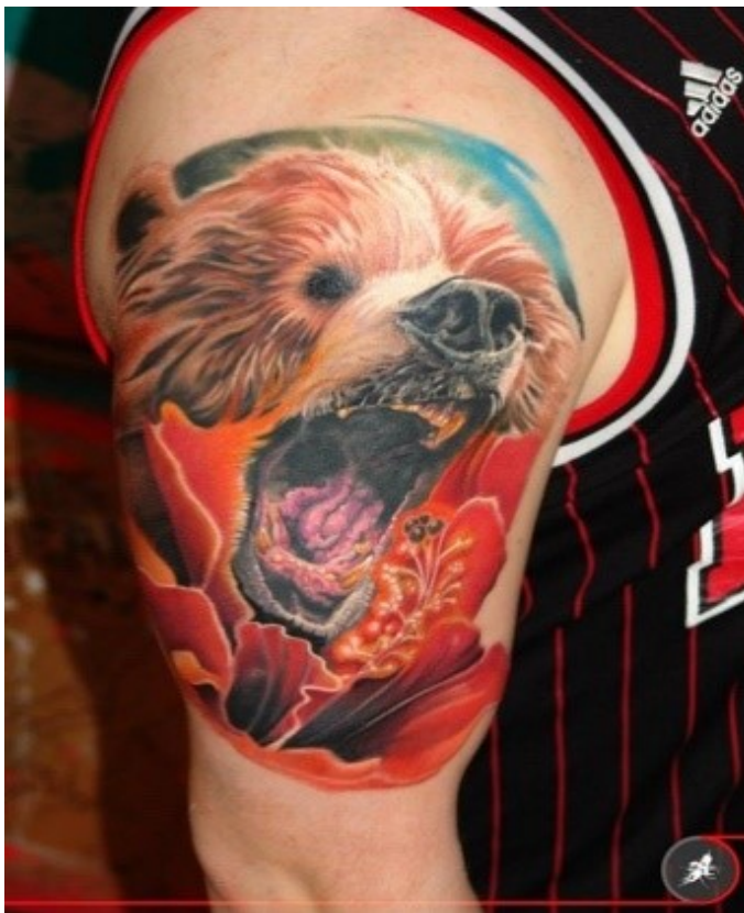
Tetováló: Jelencsik Gábor

A medve az oroszlánhoz hasonlóan az uralkodó, a harcos kaszt szimbóluma, az állatok, nyájak ura, s mivel bizonyos tekintetben emlékeztet az emberre, sok helyütt benne tisztelték az emberi nem őseit (Hoppál 2004: 207). Érdekes