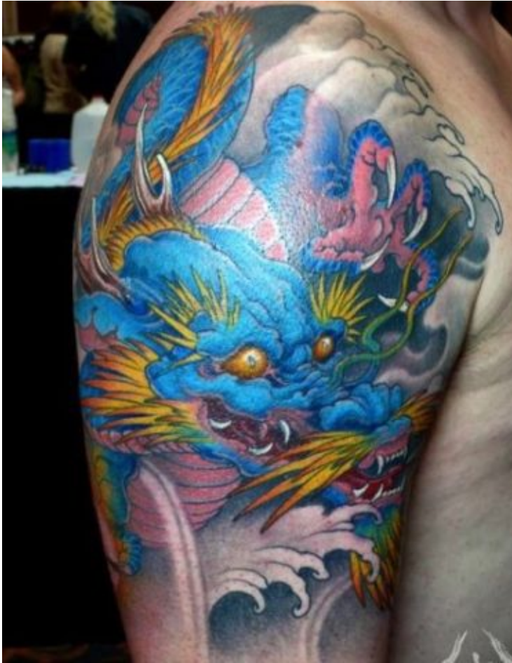
Tetováló: Shige (Japán)

A sárkány szintén nagy népszerűségnek örvend a tetoválást viselők körében. Elsősorban az ázsiai típusú sárkányt részesítik előnyben, feltehetőleg azért, mert a japán és kínai kultúra nagy hatással volt általában véve a tetoválásra, így a szimbólumai is átöröklődtek a mai tetoválásba. Kínában a sárkány nevének jelentése: „kiváló értelmű lény”, s a legfőbb bölcsesség, a halhatatlanság és a gyógyító erő birtokosa. Ő továbbá kínai isten-dinasztia megalapítója, az írás és a tudományok feltalálója, így nem csoda, hogy a kínai császár emblémája ugyancsak sárkány (Hoppál 2004: 254). Egy hajdani japán császár szintén azt hirdette, hogy ő a halhatatlan sárkány leszármazottja (Hemingston 2009: 196). A sárkánytetoválás a vizsgálatban részt vettek számára nemességet, erőt, kitartást, hűséget és hatalmat jelent, illetve jelzik a kötődésüket az ázsiai kultúra, azon belül is a jakuzák által képviselt titokzatos világ iránt. De volt olyan is, aki a kínai