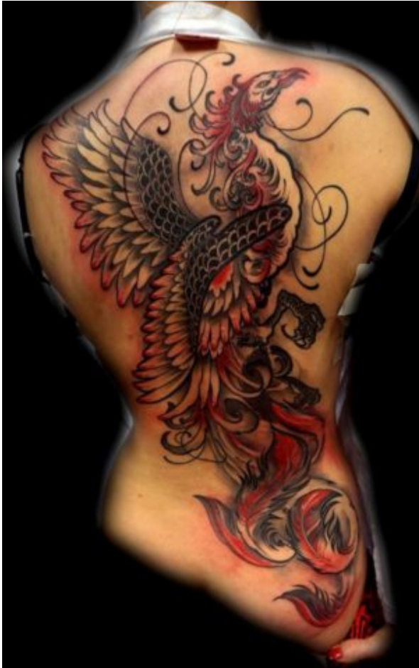
Tetováló: Várnai Kriszta

A fénix a tűzzel és az égi tűznek (Nap) a ciklikus mozgásával van kapcsolatban, így az örökkévaló élet körforgásának, az újjászületésnek és a regenerációnak a szimbóluma (Hoppál 2004: 95). A tetováltatók körében közkedvelt minta, elsősorban mint feltámadás/újjászületés, állhatatosság és kitartás szimbóluma. Továbbá, óvó/védő és figyelmeztető funkcióval bír (egyfajta talizmán).