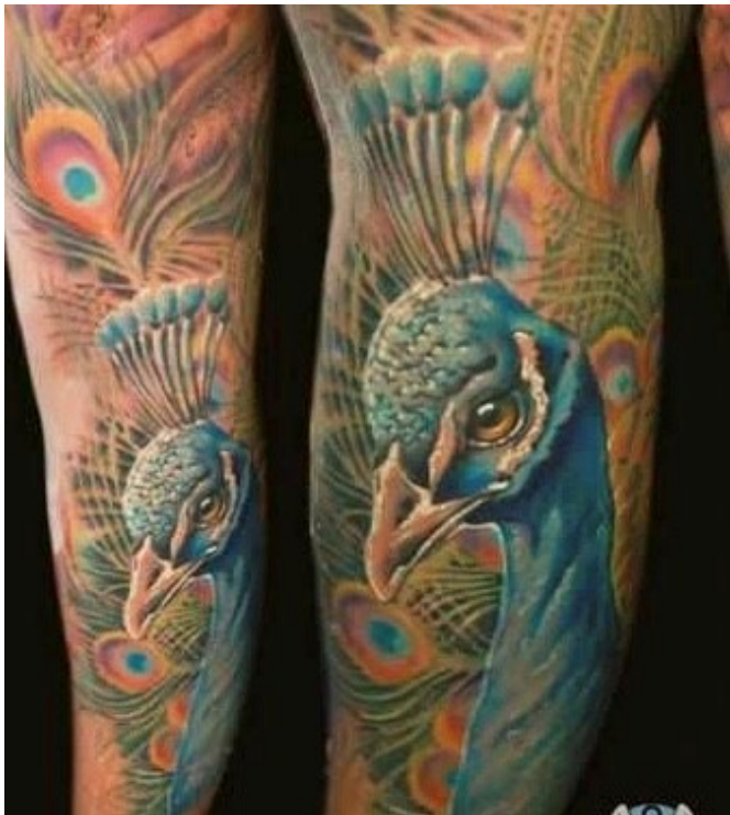
Tetováló: Hegedűs-Szilágyi Karina

Páva a teljesség és halhatatlanság jelképe. Kitárt farka a csillagos eget, valamint a világmindenséget szimbolizálja. Jelentheti továbbá a méltóságot és a szépséget is (Kína), ám némely görög költő a szép külső mögött lapuló silány jellem szimbolizálására is alkalmasnak gondolta. Sok középkori ábrázoláson lélekmadárként látni (Hoppál 2004: 238– 239).