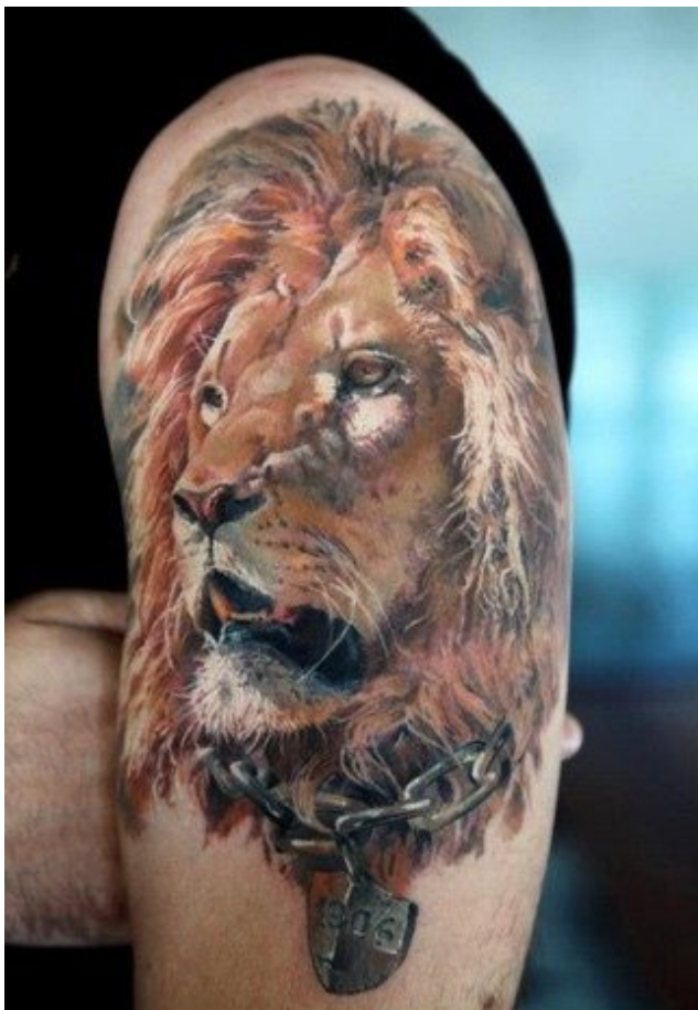
Tetováló: Dmitrij Samohin