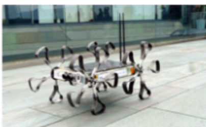
2. kép: Holdjáró