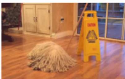
3. kép: