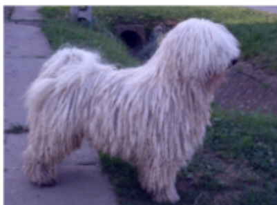
7. kép: Puli