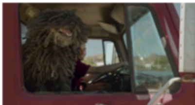
6. kép: Dr Pepper