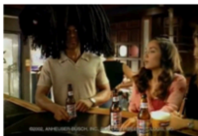
5. kép: Budweiser