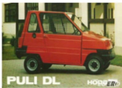
1. kép: Puli gépkocsi

interkulturális kontextusban. Az 1980-as években Francia piacra egy hódmezővásárhelyi tervező és gyártó cég alkotta meg a „Puli” márkanévű apró, de annál fürgébb gépjárművet, felismervén a puli pörgő, pattogó mozgását. (1. kép) A magyar holdkutató csoportja „Puli” elnevezésű holdjáró prototípusa szintén ennek a kutyafajtának találékonyságát sugallja. Gyors és fürgé, semmilyen akadály nem állhat az útjába. (2. kép) Több nemzetközi takarítóeszközök gyártó cég a puli zsinóros függönyszerű köntösét használja feltermékei népszerűsítéséhez. (3. és 4. kép) A puli hűsége és gazdája iránti odaadása ihletett meg több tengerentúli italgyártó vállalatot is (Budweiser és Dr Pepper). (5. és 6. kép)