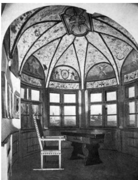
3. kép: Sub rosa terem a sárospataki Rákóczi-várban

Tipikus metaforák is vonatkoznak a titokra: intra muros – ‘falakon belül’, sub rosa – ‘rózsák alatt’.[2]