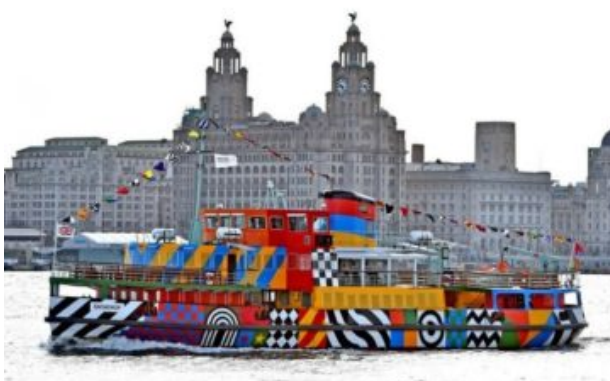
5. kép: Dazzle-painting, zebra- és egyéb csíkos hajó

háromdimenziós tárgy laposnak, illetve meghatározhatatlan alakúnak tűnik. A haditengerészet számára javasolták a hajók ellenárnyékolását. Az első világháborúban a korábban egyszínűre festett hajókat és harci járműveket elkezdték álcázó szándékkal több színnel befesteni. Norman Wilkinson angol festőművész felismerte, hogy egy hajót zebraszerű csíkozással, valamint a felépítmények kontúrjait megbontó feltűnő festéssel (dazzle-painting) megtéveszthetővé tehetnek. Ezek után az óceánt ellepték a kubista ihletésű hajók, melyek pontos körvonalait kivehetetlenné tették a szemet minden irányban (félre)vezető vonalak.