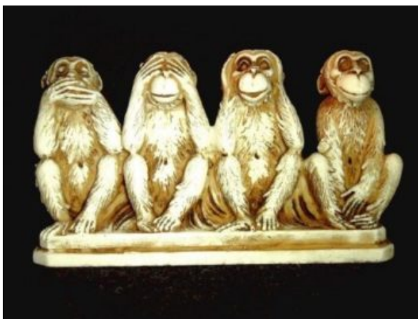
1. kép: A négy bölcs majom

A titok megjelenési formája: az érzékek elől való elzártság, a láthatatlanság (eldugás, rejtés), a hallhatatlanság (az elhallgatás). Egy társaságban a titkolandó tárgyat eldugják, elrejtik (például a szülő a gyermeke előtt háta mögé teszi a csokoládét; eljegyzéskor a férfi markába rejt a jegygyűrűt). Ha beszélgetés során titok kerül szóba, akkor az emberek elkezdnek halkabban beszélni, suttogni, szájuk elé teszik a kezüket. A titok megjelenésére utaló tipikus magyar szólás: ne szólj szám, nem fáj fejem. A titok megjelenítésének tipikus, keletről származó, a 17. századtól széles körben terjedő ábrája: a nem hall, nem lát, nem beszél. A három bölcs vagy misztikus majom a buddhista, konfucionista alapokon a következő mondást jeleníti meg: „nem lát rosszat, nem hall rosszat és nem beszél rosszat”. A nyugati világban (különösen bűnszervezetekben) a három majom a hallgatás, némaság, a titoktartás, a cinkosság jelképe lett. Hogy ez mennyire eltávolodott az eredeti szándéktól, jelzi a négy majom ábrázolása: a negyedik majom „nem tesz rosszat”, általában keresztbe tett kézfejeivel takarja el nemi szervét. Egy másik változatba a negyedik majom eltakarja az orrát, hogy ne érezze a bűzt, azaz „ne szagolja a gonoszt”.