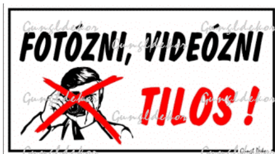
4. kép: Titokvédelmi szempontból képek készítését tiltó tábla

A tartalomhoz kapcsolódnak a jogilag szabályozott titkok: adótitok, állam- és szolgálati titok (katonai titok), banktitok, biztosítási titok, értékpapírtitok, levéltitok, magántitok, magánnyomozói titok, NATO- és EU-titok, orvosi titok, pénztártitok, postatitok, távközlési titok, ügyvédi titok, üzleti titok.