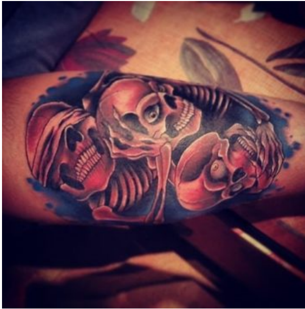
2. kép: Nem lát, nem hall, nem beszél tetoválás

A titok nem egyszerűen hallgatás vagy elhallgatás. Leopold Lajost idézi E. Bártfai (2017: 76): „A titok tárgyilag lokalizált, helyhez kötött hallgatás, a hallgatás személyileg lokalizált, ezért beláthatatlan mélységű titok.”