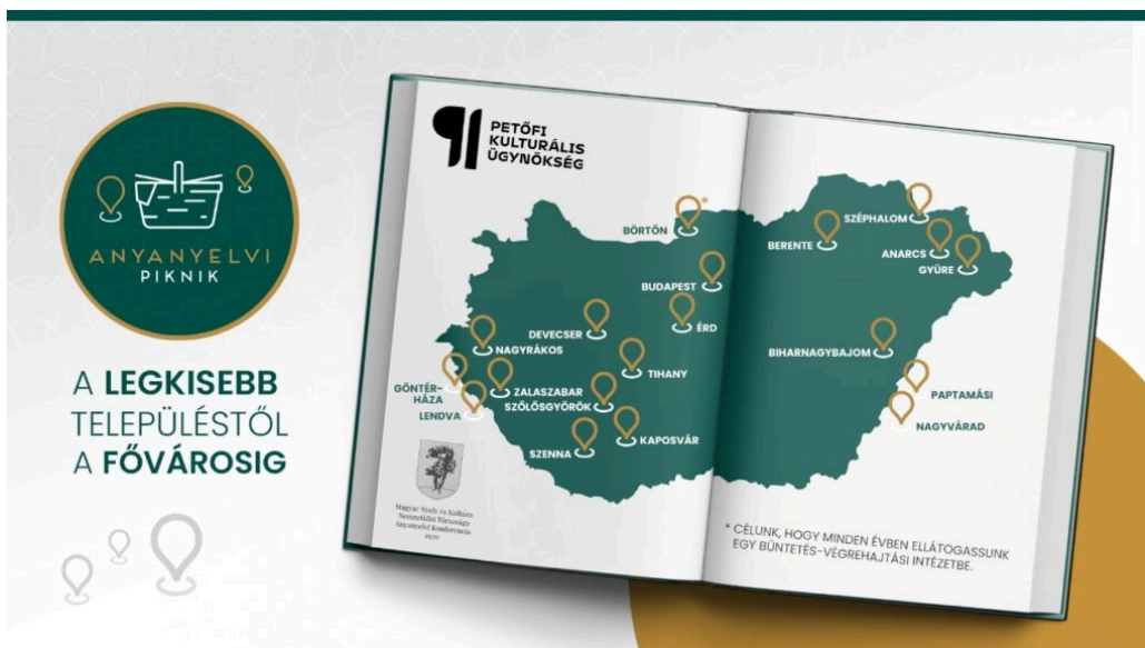
(Anyanyelvi piknik, 2024)