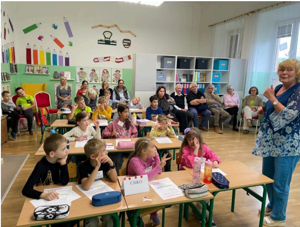
Anyanyelvi piknik Várhosszúréten (Szlovákia, 2023)