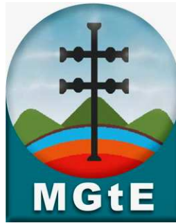
Az MGtE új logója

A következő napirendi pont az MGtE új logójának bemutatása volt. A kép egy, a felszín alatti víztárolót megcsapoló, nem szokványos termálkút fejet ábrázol oly módon, hogy benne - a magyar állami címerhez hasonlóan - megtalálható a kettős kereszt és a hármshalom.