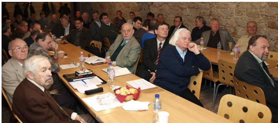
A Magyar Geotermális Egyesület tagjai az éves közgyűlésen

Tízéves újraalapításának évfordulóján a Magyar Geotermális Egyesület évi rendes közgyűlését 2013. április 9-én egy különleges helyszínen, a budapesti Klebelsberg Kultúrúria Vinotéka termében tartotta.