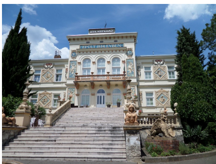
Az MTA székháza Pécsen

A kijelentés nyomán élénk beszélgetés indult el a rétegrepesztések jelenlegi hatósági engedélyezéséről. Dr. Szabó Györgynek az MGtE idei közgyűlésén elhangzott előadása óta tagjaink előtt nem ismeretlen a nem hagyományos földgáz kutatás problémája, miszerint környezetvédelmi okokra hivatkozva a rétegrepesztést évek óta nem engedélyezik Magyarországon. Márpedig ha ez így van, akkor - elvileg -