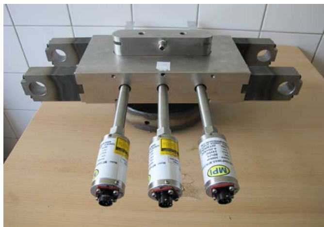
Dinamikus repesztés vezetőképesség mérő cella