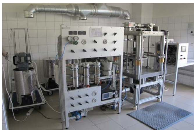
Dinamikus repesztés vezetőképesség mérő berendezés