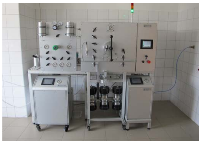
Rétegekárosodás és kavicságyas kútkiképzés vizsgálo berendezés

nyí Kutatóintézet műszerfejlesztési részlegének vezetője előadásában ismertette a projekt keretében kifejlesztett két laboratóriumi vizsgáloberendezést. A két eszköz – egy rétegekárosodás és kavicságyas kútszerkezet vizsgálo, valamint egy dinamikus repesztés vezetőképesség mérő berendezés –