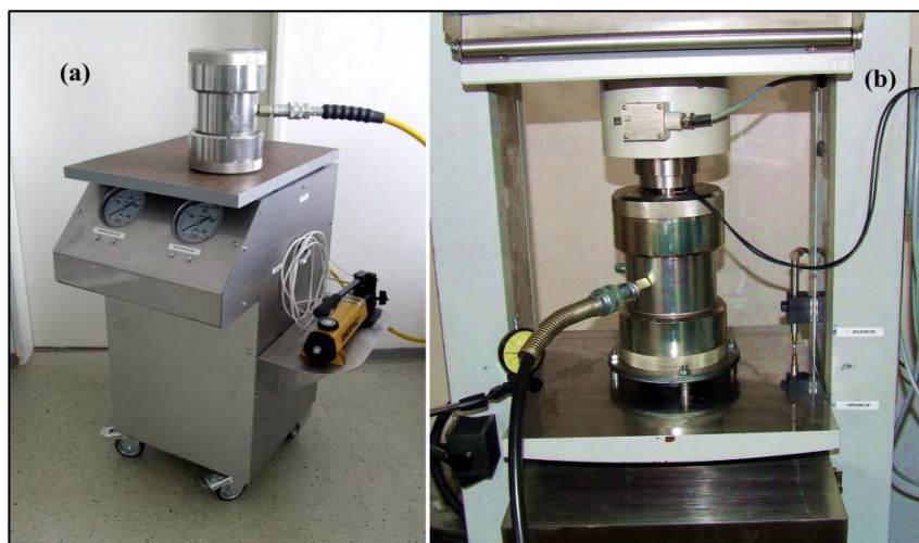
Tönkremeneteli határgörbe meghatározását – Kovári teszt – végző triaxiális mérőberendezés

kulcsszerepet fog játszani a projekt tervezett 2. ütemében. Ugyanis ezzel a két speciális laboratóriumi műszerrel lehet elvégezni azokat a vizsgálatokat, amelyek a kútkiképzési technológiák kifejlesztéséhez szükségesek. A két berendezést a PAB székházban tartott szakmai előadásokat követően az érdeklődők megtekinthették a Mecsekérc Zrt és a Geochem Kft. kővágószőlősi telephelyén.