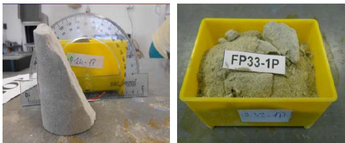
Kovári mérések két jellemző tönkremeneteli képe