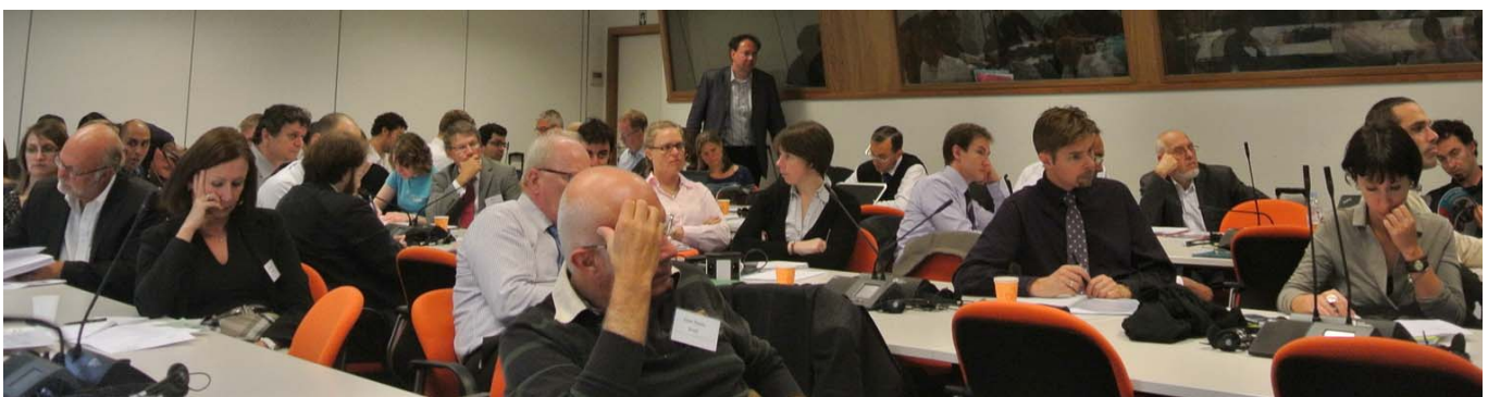
A szeptember 23-i GeoDH konferencia hallgatóságának egy része. A Megújulóenergia-házba nem fértek be.