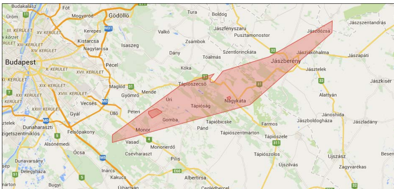
A CEGE Geotermikus Koncessziós Kft. Geotermikus kutatási területe

– Reméljük, hogy nem csúszik be hiba, de természetesen egy nagyon összetett műszaki- és projektmenedzsment folyamatról beszélünk. Valóban, nem háttér információk nélkül pályázta meg a CEGE ezt a koncessziós területet. A MOL-tól vásároltunk meg és dolgoztunk fel korábbi adatokat, tehát volt egy felmérésünk arról, hogy hol lehetne egy ilyen volumenű projektet megvalósítani az országban. Vagyis a jászberényi területtel a CEGE már korábban is foglalkozott, viszont csúszott a koncessziók kiírása, így érdemi munkát még nem tudott végezni. Szerencsére megnyertük a pályázatot, úgyhogy most indul a munka, ami nem csak műszaki feladatokból, hanem engedélyeztetésekből is áll. Utóbbi elég hosszadalmas folyamat Magyarországon. Esetünkben különösen a felszíni hasznosításra vonatkozó része lesz az, hiszen itt a pozitív kutatási eredmények vizsgálata után dől majd el, hogyan megyünk tovább. Ha villamos energiát termelő erőművet építenénk - ami rendkívül hosszadalmas és bonyolult engedélyeztetési