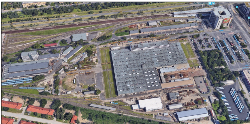
A beruházás helyszíne

Az előzetes tervek szerint a kivitelezés már 2018 őszén befejeződött volna, de a közbeszerzés elhúzódása és céges átala-