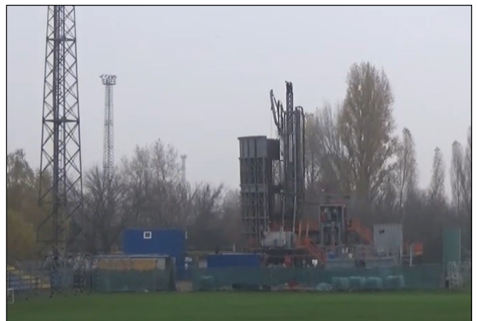
Fúrási munkálatok a Szőnyi úton

Az egyesület a környezetközpontú gondolkodásmódjával azt a célt tűzte ki, hogy a BVSC-Zugló legyen az első olyan sportegyesület, amely energiaszükségletét kizárólag megújuló energiaforrásokból fedezi.