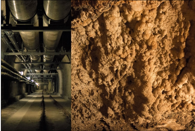
A Gellért Fürdő alagútrendszere és az Aragonit-barlang „karfiol” képződményei (Cikk forrók: Szappanos Gergő)

- Az első munkahelyemen, a Magyar Állami Földtani Intézet Tektonikai Osztályán pont egy ilyen munkába csöppentem. A kis és közepes radioaktivitású hulladék elhelyezésére kerestünk földtanilag megfelelő területet. A hosszú felezési idő miatt kellett ilyen időtávtatban gondolkodni, „megjósolni” például, miként kommunikálnak a vizek a kőzetek repedésein át, hogy radioaktív szennyeződés még földrengés esetén se kerülhessen ki a tárolóból. Összekapcsolódott az idő.