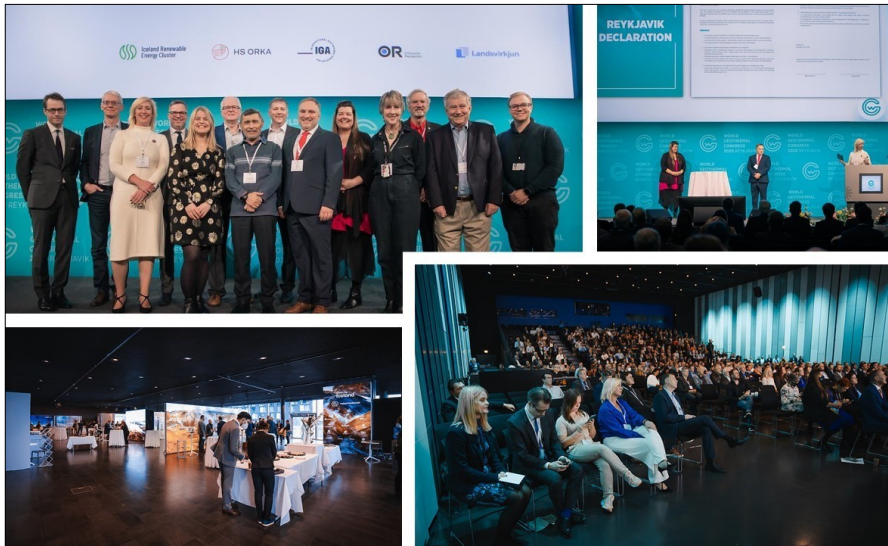
Képes egyveleg a Világtalálkozóról

Egy év kényszerű halasztást és 2020-ban online formában tartott előadásokat követően 2021. október 24-27. között megrendezték élőben is a Geotermális Világtalálkozót Izlandon, Reykjavikban.