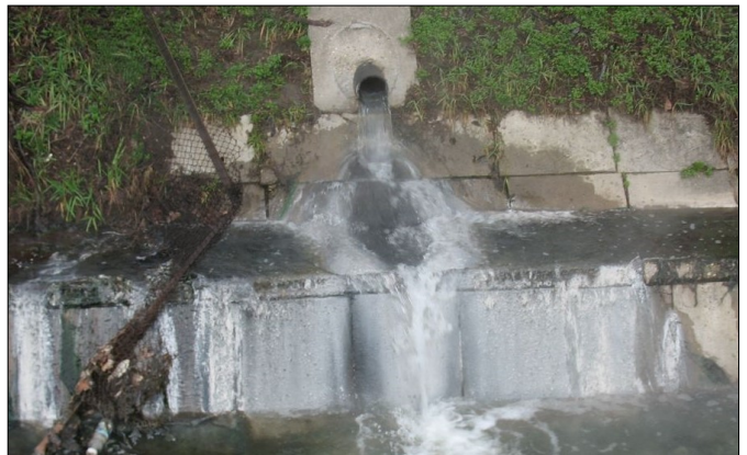
Egy sikeres „visszasajtolás” az ezredforduló környékéről

„... a felhasználó anyagilag érdekelt a termálvíz minél nagyobb részének felszíni befogadóba juttatásában, ugyanakkor anyagilag érdekelt a csurgalék termálvíz minél nagyobb része besajtolásának dokumentálásában.”