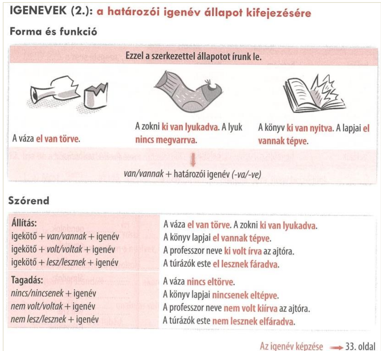
2. ábra: A [VM+BE+V ADV ] szerkezet a MagyarOK B1 + munkafüzetben (Szita & Pelcz 2023: 60)

A kapcsolódó munkafüzeti táblázat szerint (2. ábra) a [VM+BE+V ADV ] szerkezet funkciója valamilyen állapot leírása, formai megvalósulása pedig (állító mondatban) 'igekötő + van(nak)/volt(ak)/lesz(nek) + határozói igenév'. A létige ragozási paradigmája és a lett nem jelenik meg, a példamondatokban ugyanakkor változatos típusú – ti. tranzitív ágentív: eltép, eltör és intranszitiv nem-ágentív: kilyukad, elfárad – igeik szerepelnek. A leírás így azt sugallja, hogy a szerkezet harmadik személyben korlátlanul használható dolgok és személyek állapotának a leírására tetszőleges igekötős ige mellett, tetszőleges kontextusokban. Nem található információ arra vonatkozóan, hogy milyen szemantikájú igékből állítható elő a szerkezet grammatikai megszorítások nélkül és azok mellett (vö. 2.1. fejezet 1-es, 2-es és 3-as csoport), és arról sem esik szó, hogy milyen pragmatikai (és szociokulturális) feltételek mellett használható a kifejezés (pl. beszélői szándék, nyelvhelyességi ideológiák és attitűdök).