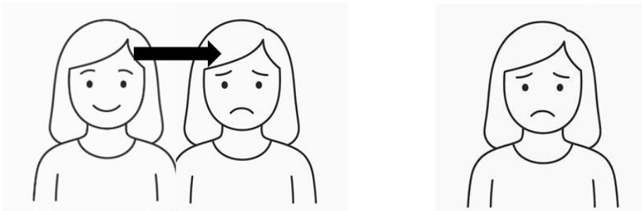
11. ábra: Szonja elkeseredik vs. Szonja el van keseredve

Csakis ennek a konstrukciónak a megértése után érdemes a konstrukció 2. típusát bevonni a tanításba (lásd 2.1. 2-es csoport): az olyan eseteket, ahol intranzitív, dinamikus (állapotváltozást kifejező), experiens alanyú mediális (pl. eltörik , megfázik ), illetve pszichikai alapige (pl. meglepődik , felháborodik ) szerepel a létigés határozói igeneves szerkezetben. Az ilyen esetben megjelenített eredményállapot (pl. Szonja el van keseredve , lásd (5b)) előzménye egy olyan folyamat, ahol egy átélő (nem akaratlagosan cselekvő) szereplővel megtörténik egy esemény: megváltozik az állapota (pl. Szonja elkeseredik ). Az alany-ige és a [VM+BE+V ADV ] konstrukció alanya is az átélő szereplő, de míg az előzőben a dinamikus folyamatra irányul a figyelem, addig az utóbbiban a bekövetkezett statikus állapotra. Jól szemléltethető ez a különbség egy mozgóképpel (vagy annak hiányában a változást jelölő nyíllal) (kérdés: Mi történik Szonjával? ) és egy statikus képpel (kérdés: Hogy van Szonja? ) (11. ábra).