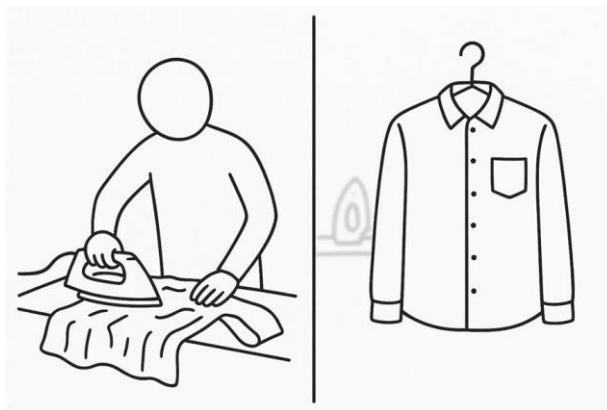
8. ábra: Valaki kivasalja az inget vs. Ki van vasalva az ing

Második lépésben tágabb szituációs kontextusban mutatjuk be a konstrukciót, a vele asszociált pragmatikai szándék alapján 4 . Ehhez jó technika lehet a Minden készen van? névre keresztelt checklist (teendőlista) feladat, amikor valamire vagy valahova készülve 5 szisztematikusan listázzuk az elvégzendő feladatok kívánatos eredményét. Például abban a kontextusban, hogy reggel indulunk az egyetemre, készíthetünk egy, a 9. ábrához hasonló listát. A tanulók feladata lehet az, hogy válogassák ki, melyik elem releváns reggelente: ami szerintük releváns, azt pipálják ki (pl. a könyveim el vannak pakolva ), ami szerintük nem az, azt ikszeljék be (pl. a fürdőruhám ki van mosva ).