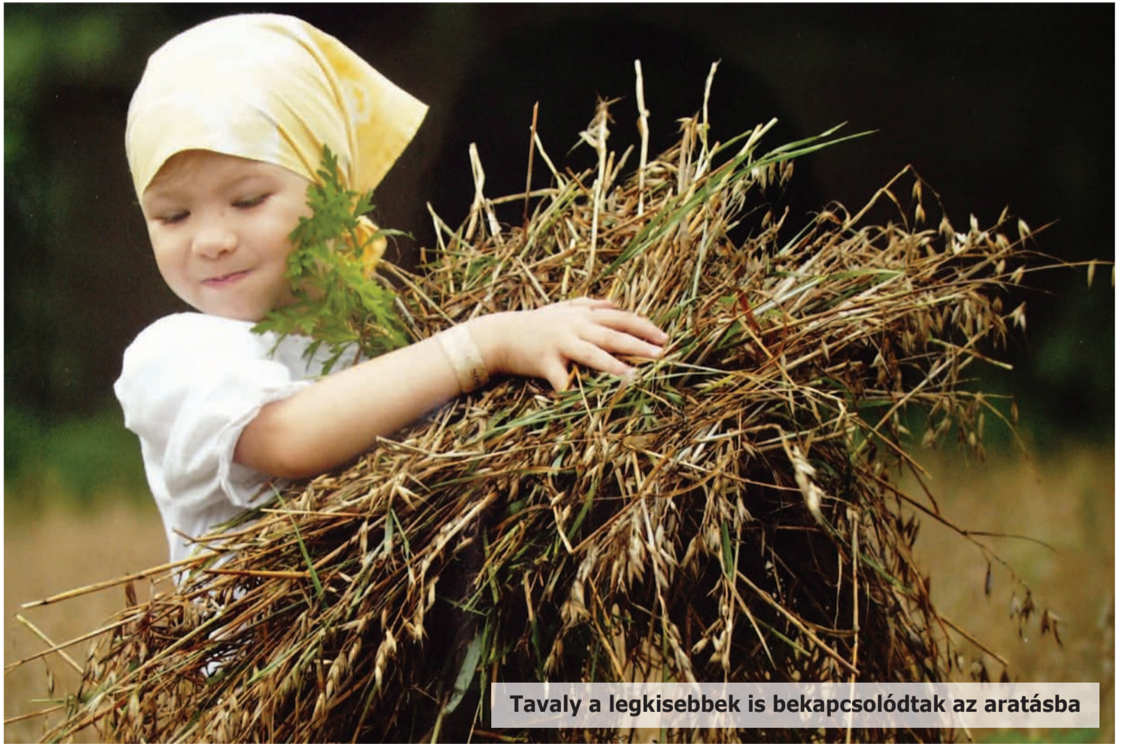
Tavaly a legkisebbek is bekapcsolódtak az aratásba