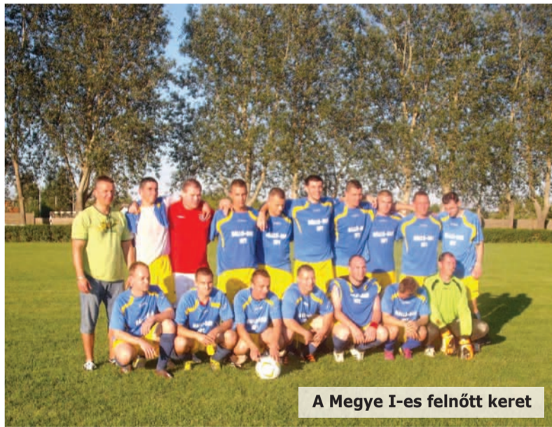
A Megye I-es felnőtt keret