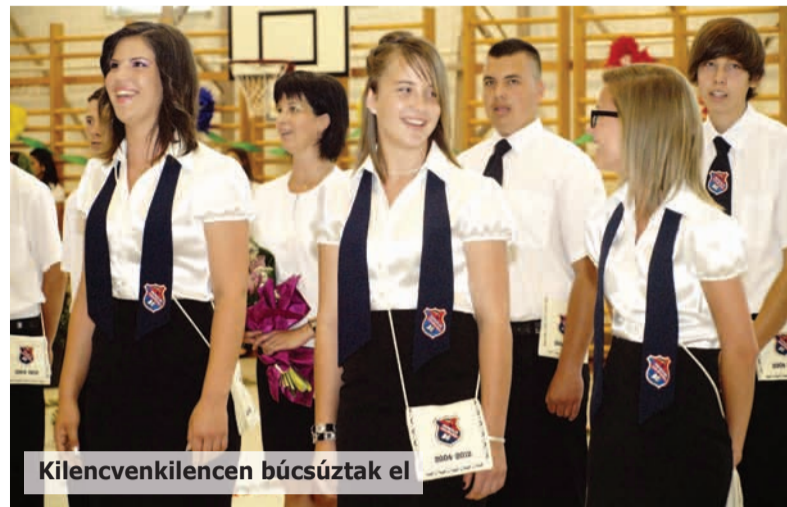
Kilencvenkilencen búcsúztak el

Négy osztály végzősei ballagtak el a Nagykállói Általános Iskolából. A 99 nyolcadikos tiszteletére az iskola és a Városi Sportszarnok is virágdíszbe öltözött.