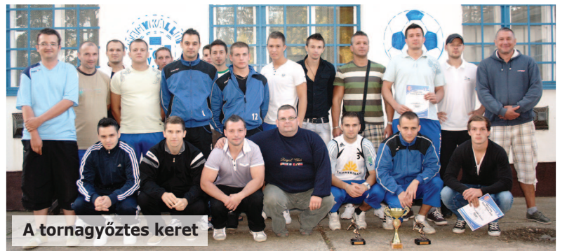
A tornagyőztes keret