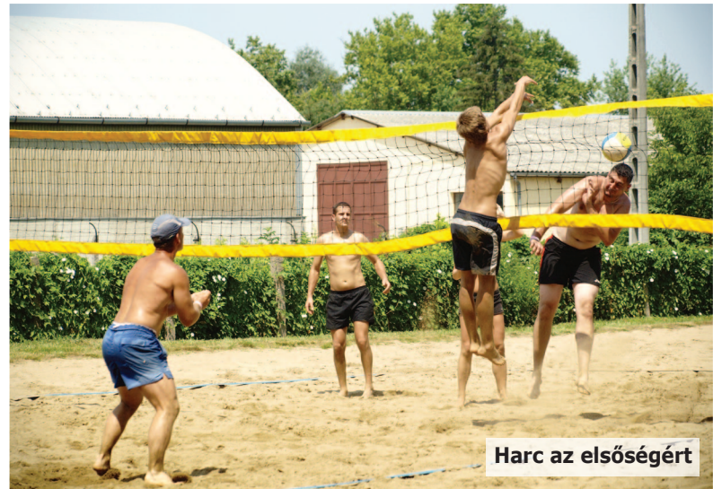
Harc az elsőségért

Amatőr strandröplabda tornát rendezett a Nagykállói Röplabda Egyesület a közelmúltban. A Nap Strandon megrendezett egy napos viadalon körmérkőzéses rendszerben, nyolc csapat mérkőzött meg az elsőségért. Az amatőr tornát immár 11. alkalommal hívták életre a szervezők.