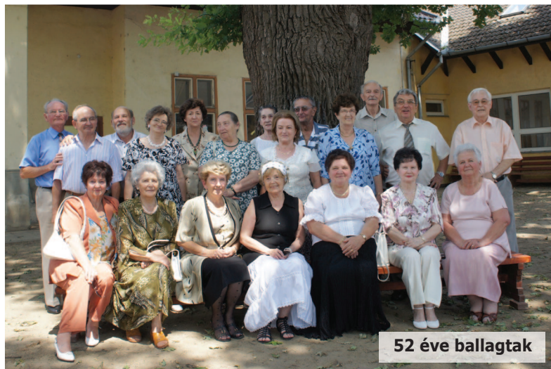
52 éve ballagtak

Immár tizedik alkalommal gyűltek össze az 1960-ban érettségizett diákok találkozóra. Igen, 52 éve hangzott fel a „Ballag már a vén diák...” a nagykállói Budai Nagy Antal Gimnázium IV. HUMÁN és REÁL tagozatának. Az akkori 57 diákból 21-en jelentünk meg, van, aki nem jött, és vannak, akik már nem jöhettek! Jó hangulatban töltöttük 2012. június 30-át volt iskolánkban, melynek udvarán még ott áll az öreg tölgyfa. Igaz testben megváltoztunk, de lélekben ifjak maradtunk, egymás iránt érdeklődők, egymást értékelők, odafigyelők, együtt érzők. Mindemellett vidámak, nótás kedvűek, pozitív gondolkodású, reménykedő 70 évesek. 3 év múlva újra találkozunk. Viszontlátásra!