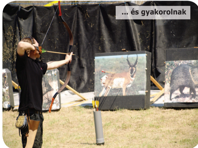
... és gyakorolnak