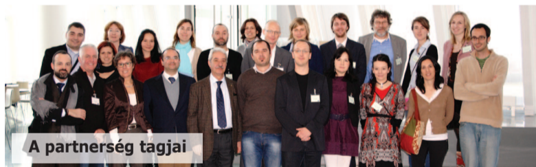
A partnerség tagjai

Városunknak lehetősége nyílt 10 európai partnerrel együttműködésben pályázatot benyújtania egy nemzetközi program (Interreg IVC, Labour Plus) keretében, amely támogató döntésben részesült.