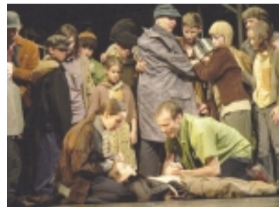
Jelenetek a darabból

naponta küzdenek a túlélésért. Gergő az egyik ilyen árva közülük, akit lelőnek egy krumpli lopásnál. Megrendítő volt látni, ahogyan eltemetik egy gödörbe a társai. A 2 és fél óras darab érzelmeimmel teli történet, amely minden korosztálynak szól. Vidám és egyben szomorú.