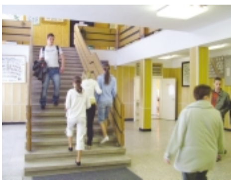
Ide hamarosan lift épül

Még az elmúlt év végén tartottak avatóünnepséget a Nagykállói Gimnázium, Szakközépiskola és Kollégium Budai Nagy Antal Szakközépiskola Intézményegység épületében, amikor befejeződtek a rekonstrukciós munkálatok. Ennek során megtörtént az épület hőszigetelése, a nyílászárók cse-