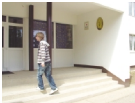
Az intézménybe bejutást rámpa is segíti majd

Az oktatási intézményben a támogatási szerződés megkötését követően, megkezdődhetnek a munkálatok, amelynek során az elsődleges cél az akadályok számának csökkentése. Például az öltözőkhöz vezető ajtók akadályt jelentenek, nincsen felvonó, a bejáratok, vészkijáratok nem akadálymentesek, nincsenek rámpák, illetve nincs vezetőkorlát elhelyezve. A projekt megvalósítása során a meglévő lépcsők járófelületei csúszásgátló módon lesznek kialakítva, az előcsarnokban pedig külön gépészeti tervek alapján fog elkészülni a felvonó. Az