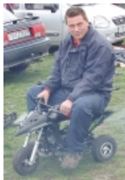
Amikor nem a méret a lényeg