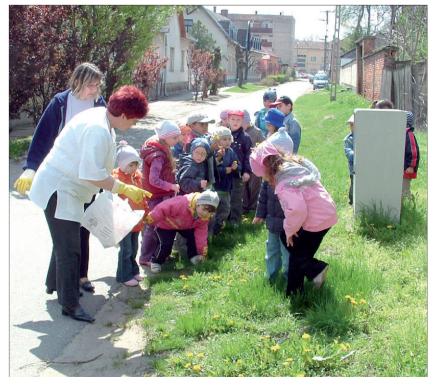
A Petőfi utcán az óvodások szedték a szemetet

Nagykállóban 2010. április 22-én a Városvédő Egyesület tagjai, az általános- és középiskolák diákjai, tanárai, a Polgármesteri Hivatal dolgozói és a hadra fogható civil szervezetek képviselői is csatlakoztak ahhoz az országos szemétygyűjtési akcióhoz, melyet a Magyar Közút Nonprofit Zrt. Igazgatósága hirdetett meg. A Föld Napján reggel 9 órakor a főtéren gyülekeztek az aktivisták és indultak, ha nem is a Föld, de egy apró szegletének megtisztítására. Az általános iskolások, a Városvédők és az Nyugdíjas Egyesület tagjai a városban belül; a középiskolások a Korányi F. úton, és a városon kívül a felüljáróig, a Szakiskolák diákok a Nagykálló és Kállósejny közötti több mint 3 kilométeres útszakaszon szedtek össze több zsáknyi szemetet az út széléről és az árokban, a hivatal dolgozói pedig az egykori hulladéklerakó környékén szüntették meg több illegális szeméthegyét. Az igazgatóság munkatársai az akcióban résztvevő nagykállói „környezetvédőknek” kesztyűt és láthatósági mellényt is biztosítottak, illetve el-