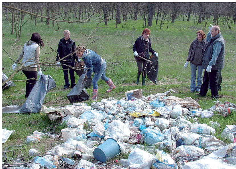
A hivatal dolgozói több hasonló illegális lerakót számoltak fel

Nagykálló Város Polgármesteri Hivatala 2009. október 1-jén környezetközpontú irányítási rendszert vezetett be. Ezzel elkötelezte magát a környezetvédelem jogi és egyéb követelményeinek.