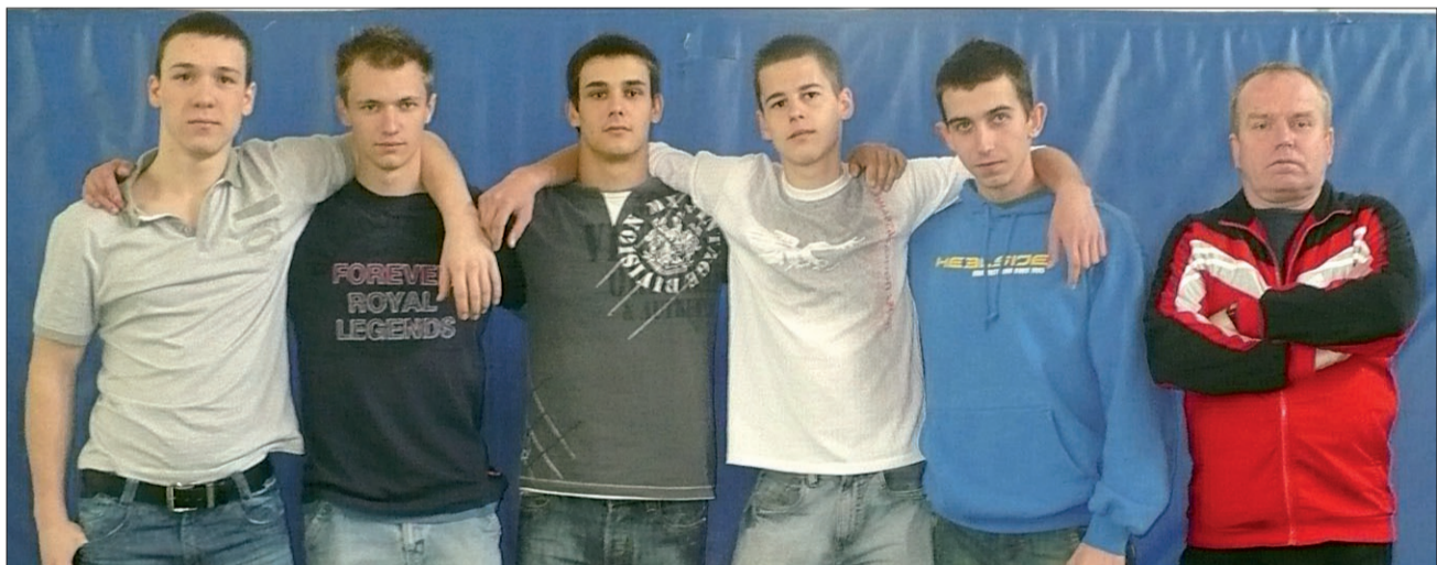
Az eredményes rendezőcsapat