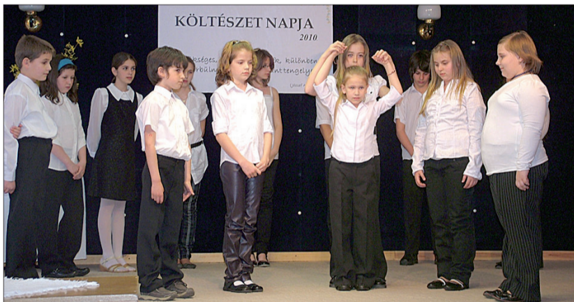
A Szín-Kör Stúdió színjátszói a Költészet napi rendezvényen