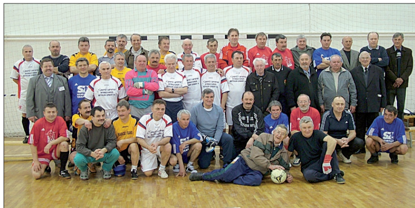
Az emléktorna résztvevői