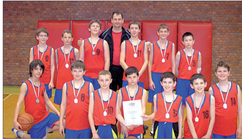
Kosárlabda megyei diákolimpia ezüstérmes csapata

Gratulálunk a fiúknak, és további sikereket kívánunk!