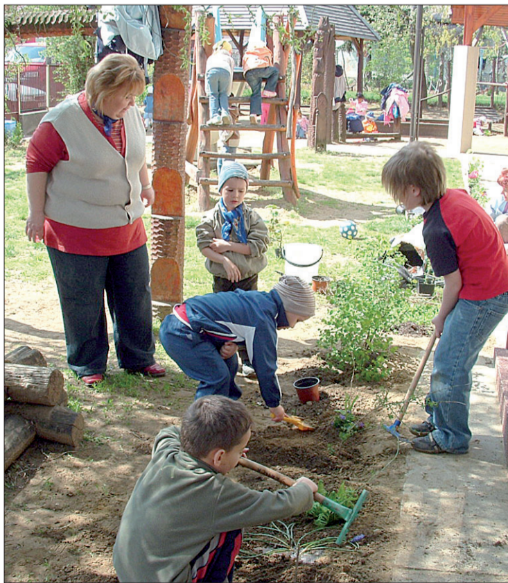
Kertész leszek, fát nevelek