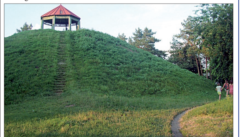
Megújul az Inségdomb és környéke is

Polgármester úr elmondta, a jövő év elején ismét összeülnek a városfejlesztési kollégium tagjai. „Az előtűnk álló 5–10 év városfejlesztési koncepciójának megalkotása szintén a nagykállói emberek, civil szervezetek, a városfejlesztési kollégiumok tagjai, helyi vállalkozók, építésszek összefogásával fog megszületni.”