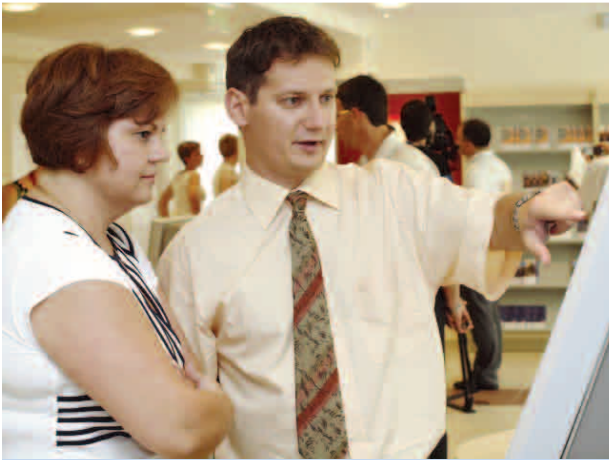
Ismerkedés a kioszkkal