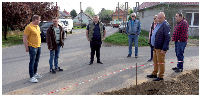
További útfelújításokról egyeztetnek a képviselő-testület tagjai