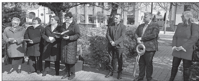
Emlékezők a Nagyságos Fejedelem mellszobránál

a háborús fenyegettség miatt előbb lehetetlen.