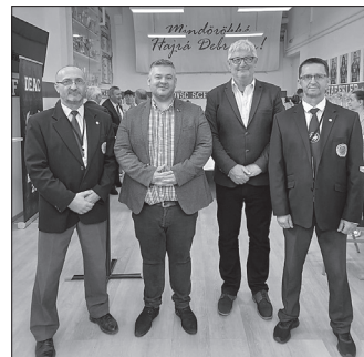
Polgármester úr és a sport bizottság elnöke a helyszínen szurkolt a karatésoknak

A magyar csapat az Európa Kupában az összesített csapatversenyben Románia mögött a 2. helyen végzett. A magyar karatékák elsősorban az utánpótlás kategóriában jeleskedtek. A haladóknál is a románok szereztek a legtöbb aranyérmet. Magyarország a 6. helyen zárt a nemzetek versenyében.