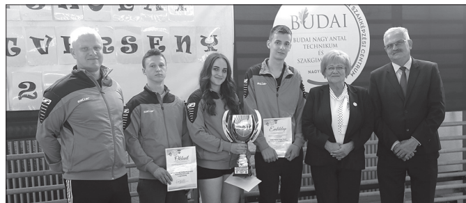
A Budai csapata

Hat sikeres megyei rendészeti csapatverseny megszervezése és lebonyolítása után, idén - a hetedikre - a régió rendészeti képzést folytató középiskoláiból is várták a csapatokat Nagykállóba, április 12-én. A MSzC Budai Nagy Antal Technikum és Szakgimnázium a Szabolcs-Szatmár-Bereg Vármegyei Rendőr-főkapitánysággal közösen szervezte meg az I. Regionális Középiskolai Rendészeti Csapatversenyt. Az immár regionálissá bővült megmérettetés célja a rendészet és közszolgálat ágazati képzésben tanuló diákok rendészeti pálya felé irányítása, a tehetségek kiválasztása, a csapatszellem, az összetartozás érzésének erősítése. A régióból 14 csapat vett részt a