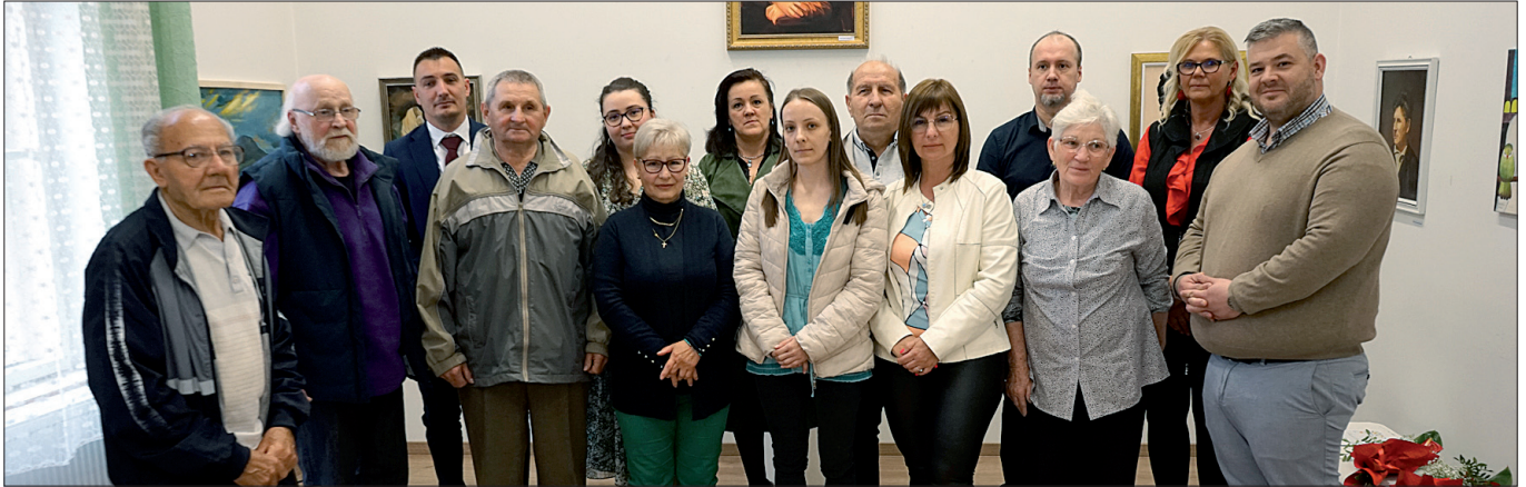
A 11. Nagykállói Tavaszi Tárlat alkotói, közreműködői, támogatói