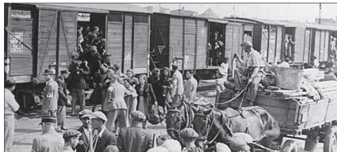
Ilyen tehervonatokkal deportálták a zsidó lakosságot 1944 tavaszán Magyarországról a vesztőhelyekre

1944 tavaszán észak-nyugat, nyugat felé indultak el a tehervagonokból álló vasúti szerelvények. Egy-egy vagonban 70-80 zsidó ember - vegyesen férfi, nő, gyerek - állt összezsúfolva. A célállomások: Dachau és Auschwitz.