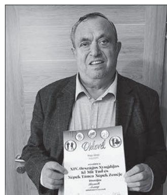
Újabb elismerés a nagykállói harmonikásnak

Lelkesedése, a harmonika, a zene iránti szeretete, mint sem lankadt az elmúlt 50 év során, ha teheti, minden nap játszik harmonikáján, mert számára a zene az önkifejezés legszebb formája.