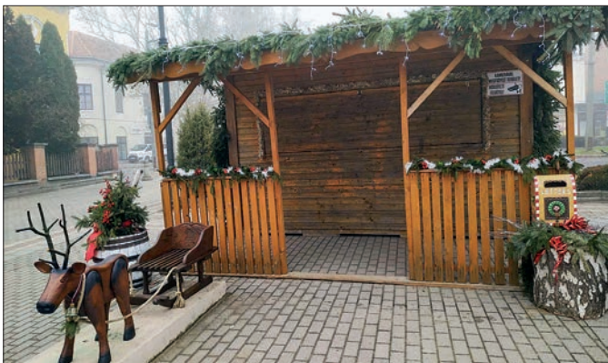
A Nagykállói Közhasznú Nonprofit Kft. munkatársai által a Szabadság téren csodásan feldíszított házikó Mikulás-hetében a nagyszakállú „otthona”, azon túl közösségi tér és szelfipont.