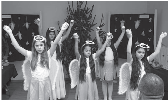
Az iskolások angyaltánca

állítás. Ünnepi beszédében szólt arról, hogy karácsony közeledtével felértékelődik az angyalok szerepe, az angyalok jelenlére, spirituálisan és materiálisan egyaránt. Advent idején otthonaink díszítésének egyik legkedveltebb eleme az angyalfigurák megjelenése. De az angyalok nem csupán a karácsonyi dekoráció részei, hanem szimbólumai a védelmezésnek, szeretetnek, békének és az isteni üzenetek közvetítésének.