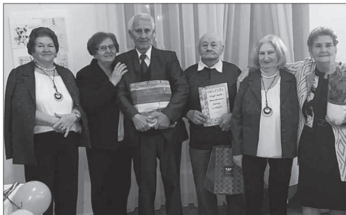
A közösség tagjai az elnök úrnak és feleségének az Egyesületért végzett eredményes munkáját ismerték el meglepetésajándékkal