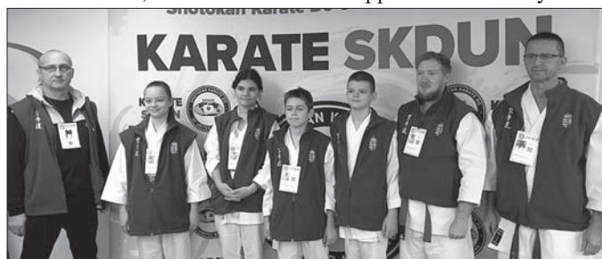
A nagykállói sportolók kiválóan szerepeltek a világbajnokságon

A sportolók ezúton is köszönetüket fejezik ki Nagykálló Város Önkormányzata támogatásáért.