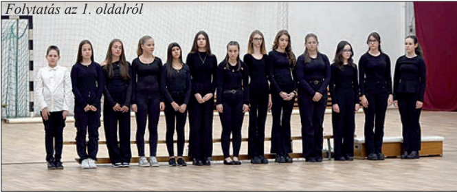
A hősökre és az áldozatokra emlékeztek