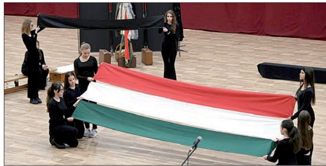
A Nagykovácsói Általános Iskola és AMI tanulói mélyen megindító műsort adtak elő

A magyar embereket 1956 októberében a szabadság hiánya