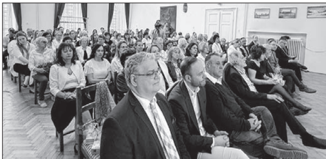
A Nagykállói Sántha Kálmán Tagkórház egykori és jelenlegi munkatársai az ünnepi eseményen