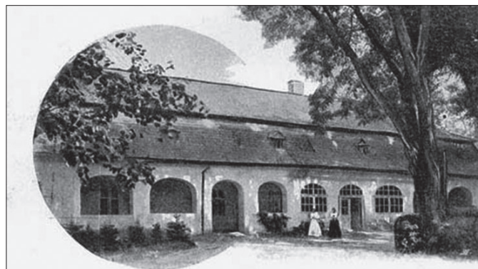
A Kiskállói Kállay kastély 1947-ig

Éltek a mai lakott terület mögött északra szarmaták és magya-