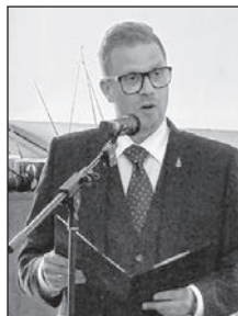
Kerezi Antal alpolgármester mondott köszöntőt a jubileumi eseményen