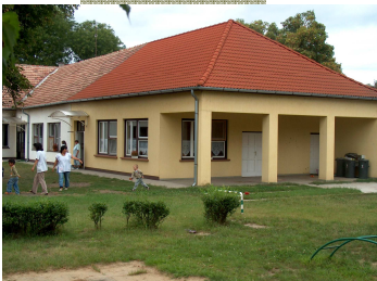
2000. Központi Óvoda építése