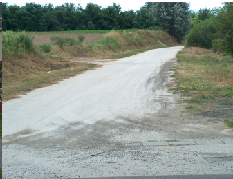
2000. Északi bekötő út