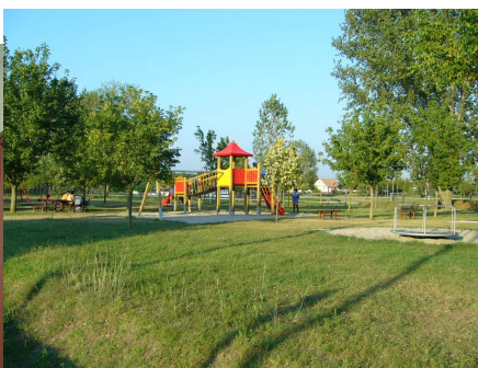
2010. Játsszótér felújítása