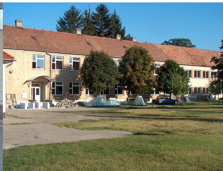
2010. Nyilászáró korszerűsítés