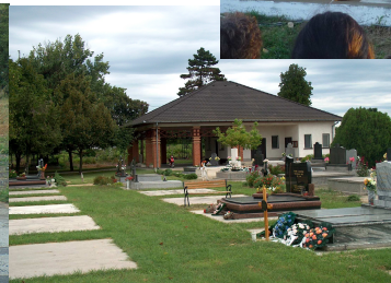
2000. Ravatalozó felújítása