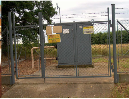
1996. Vezetékes földgázberuházás