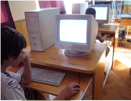
Informatika tanterem az iskolában