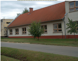
1998. Új iskolaszárny