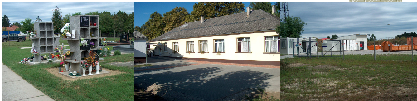
Urnafal a temetőben Nyílászáró korszerűsítése Hulladékgyűjtő udvar