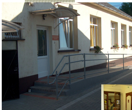
2010. Akadálymentesítés a Polgármesteri hivatalban