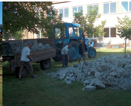
2010. Sportsarnok felújítása

Vannak-e olyan célok, amelyeket nem sikerült megvalósítani, amely félig valósult meg és az utódok feladata marad?