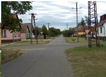
2002. Deák Ferenc utca