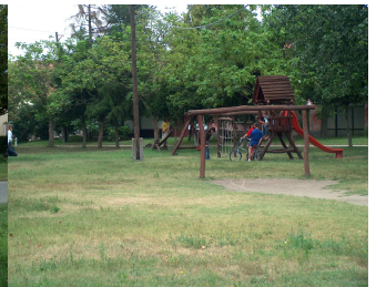
2006. Ady utcai játszótér