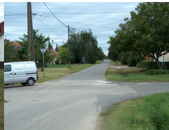
2005. Petőfi Sándor utca