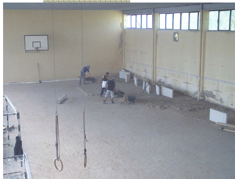
2010. Padozat csere a sportsarnokban