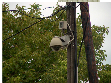
2008. Térfigyelő rendszer kiépítése