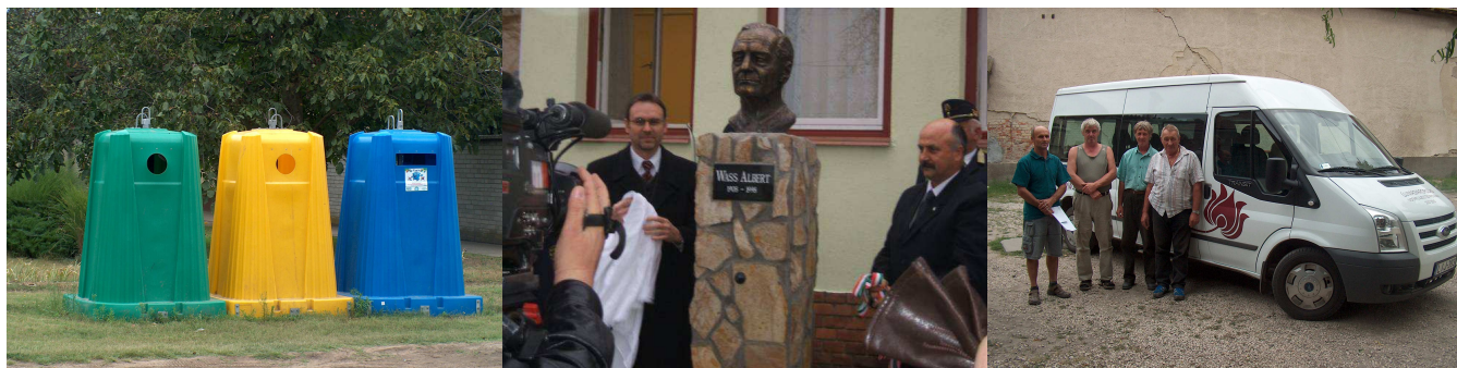
2002. Hulladékgyűjtő szigetek létesítése 2006. Wass Albert szobor avatása 2008. Kisbusz vásárlása