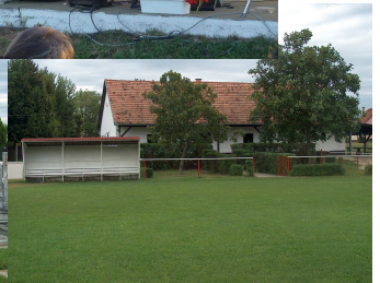
1999. Sportpálya öltöző bővítése