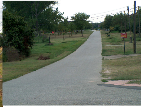
1997. Mártírok utca