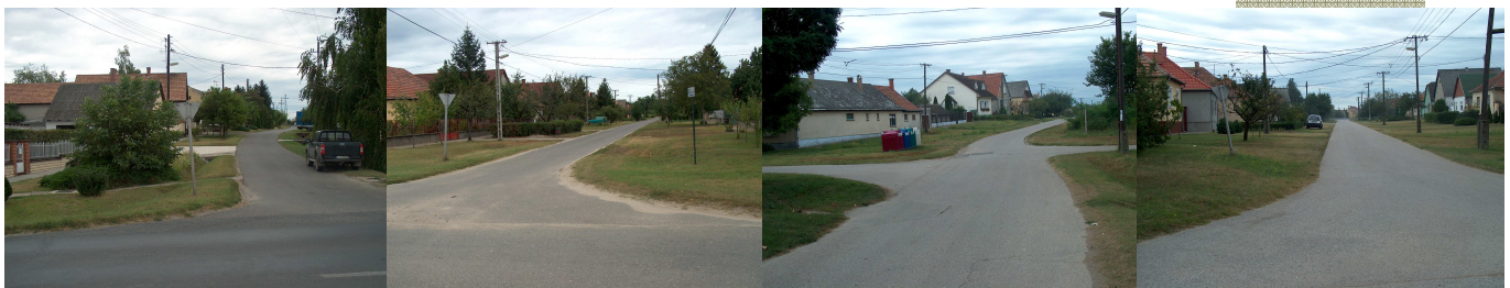
1991. Bajcsy utca