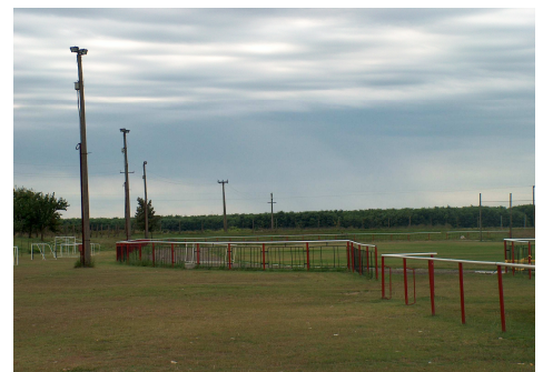
2002. Sportpálya világítás korszerűsítése