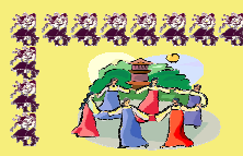
Táncház a Művelődési Házban