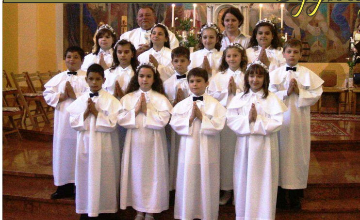
2011. május 29-én 13 kiskgyerek vette magához először az Oltáriszentiséget.