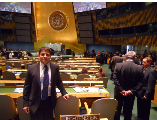
Az ENSZ Közgyűlés üléstermében

Agrárgazdasági és agrárpolitikai elemzéseket írok, képviselem Magyarországot mezőgazdasági és élelmiszeripari kérdésekben az amerikai törvényhozás és kormányzat előtt, ha jön egy felsőszintű