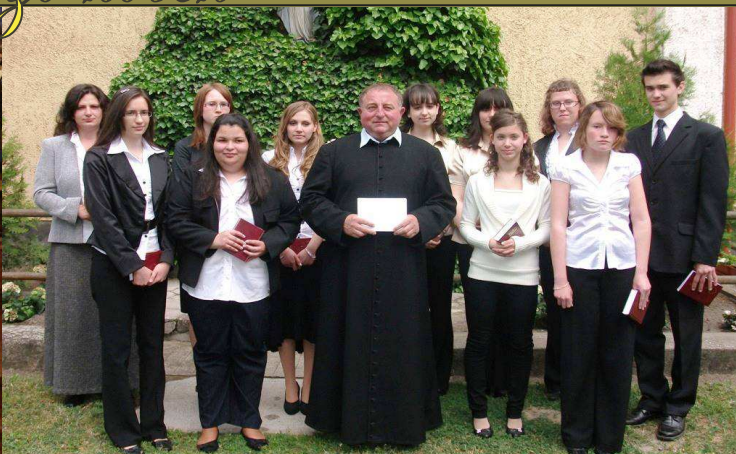
2011. május 15-én, a bajai Szent József templomban 10 sükösi fiatal részesült a Bértálás szentségében.