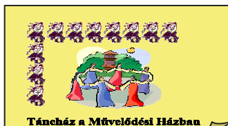
Táncház a Művelődési Házban

AA csoport találkozói minden szerdán délután 5 órakor.