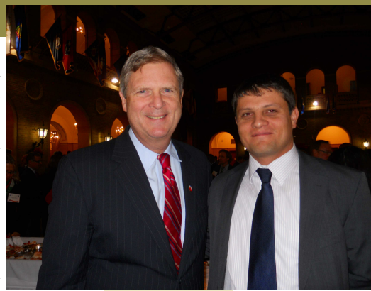
Tom Vilsack amerikai mezőgazdasági miniszterrel