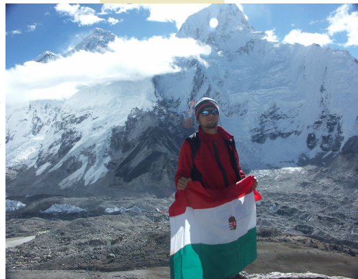
A Himalájában 5500 m magasan, háttérben az Everest