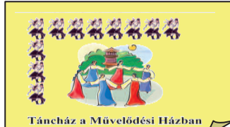
Táncház a Művelődési Házban

Asztalitenisz Kedden, Pénteken és Vasárnap délután 16:00-tól 19:00-ig.