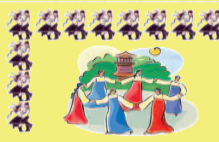
Táncház a Művelődési Házban

Asztalitenisz Kedden, pénteken és vasárnap délután 16:00-tól 19:00-ig a Lakodalmas Házban.