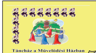
Táncház a Művelődési Házban

RIPITYOM Néptánc Minden csütörtökön 7- kor a Művelődési Ház nagy- termében