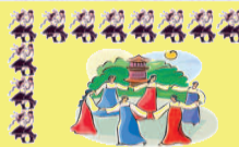
Táncház a Művelődési Házban

Asztalitenisz Kedden, pénteken és vasárnap délután 16:00-tól 19:00-ig a Lakodalmas Házban.