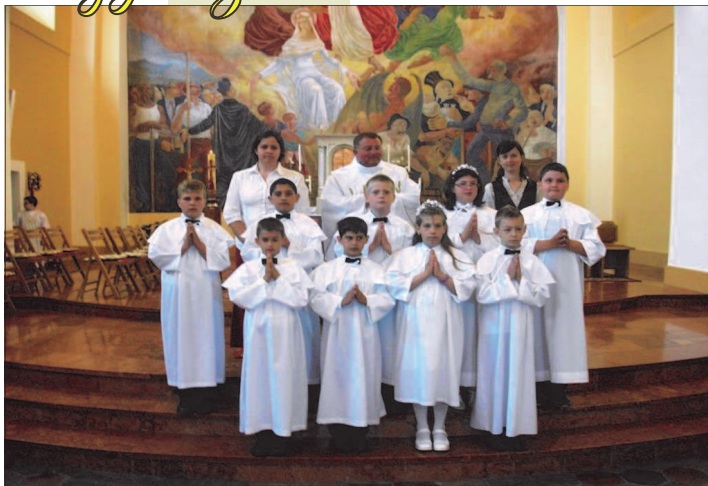
2012. május 20-án 9 gyermek vette fel az áldozás szentségét a Sükösdői Római Katolikus Templomban.