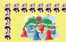
Táncház a Művelődési Házban

Néptánc Minden csütörtökön 7-kor a Művelődési Ház nagytermében