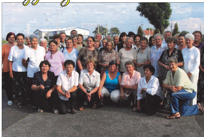
A Római Katolikus Karitászsükösdői csoportja az idei évben Mátraverebély-Szentkúton járt 2 napos zarándoklaton, ahol részt vettek a Nagyboldogasszony-napi búcsún.

A csapattal Nadapon táboroztunk, a Velencei-hegységben, a vépi cserkészekkel együtt. Ez volt a 23. csapattáborunk, egyben egy jubileumi tábor is, mert idén 100 éves a Magyar Cserkészszövetség. Mint minden évben, idén is keretbe foglaltuk a tábor eseményeit, most a nemzeti ünnepeink voltak soron, ezekre épültek a programok. Visszatérő táborozóink már megszokhatták, hogy ez a 10 nap mindig felejthetetlen élményt nyújt, a cserkészek sok tapasztalattal gazdagodhatnak, új emberekkel találkozhatnak, megismerkedhetnek a természettel, és egész életük során használható tudásra tehetnek szert. A tábor előtti nap néhány segítőkész ember és a nagyobb cserkészek elutaztak a helyszínre, és előkészítették a terepet. Ezután már nem volt más hátra, mint a nagytáborozók érkezése. Ez korai ébredést követelt meg tőlük, de aki korán kel, aranyat lel. Hisz aki barátot talál, kincset talál. Barátokban pedig nem volt hiány. Az első pár napban a tábor építésén volt a hangsúly, felállítottuk a sátrakat, a