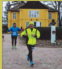
Gratulálunk teljesítményedhez! Röviden 2013.02.03. 10:00:11 02:56:44 100 NEA