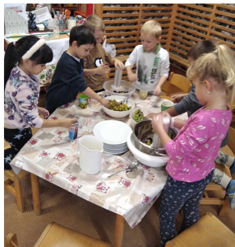
Must készítése az oviban.