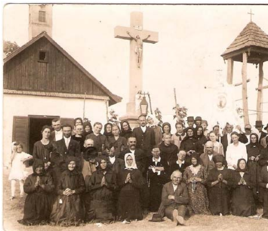
Tápiói búcsú 1929-ben