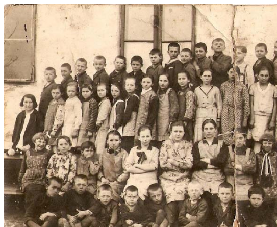
Iskolai csoportkép 1932-ből