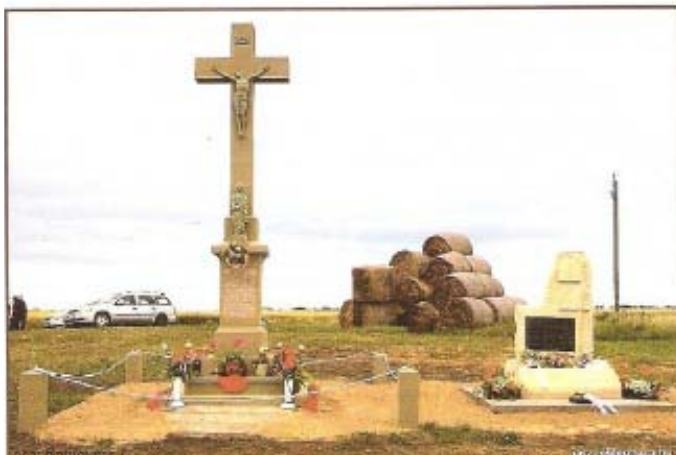
A felújított kereszt és iskolai emlékkő 2010. június 2-án