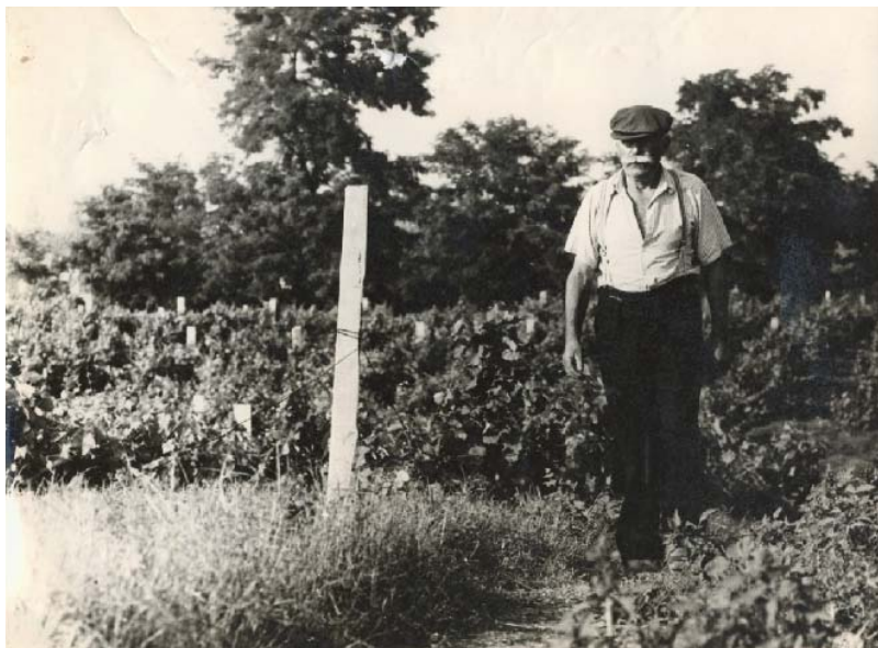
Egy szőlősgazda szemlét tart

A mellékelt három térképvázlaton az 1960/70-es években készült térképen láthatók a volt szőlők helyszínei. Mindhárom helyszínen a sötétebb színezés a balti szint fölötti 95 métert meghaladó magasságot jelzi, a térkép méretaránya pedig ugyanaz. Az egyes kép az Öreg szőlőknek nevezett területet ábrázolja. A helyszín beazonosítható a bal felső sarokban található faluszéllal, a bal alsó sarokban pedig a nehezen járható út a jásztelki 3232-es számú összekötő út. Azért szerepel rajta ez a megnevezés, mert 1968 előtt – az eredeti térkép készítésekor – földút volt.