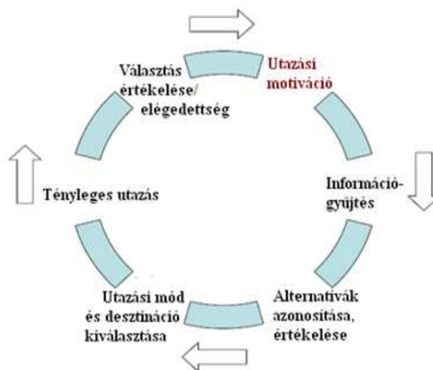
1. ábra: Az utazási döntéshozatal lépései