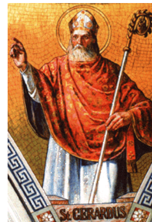
Szent Gellért vértanú püspök

GELLÉRT 980 körül született velencei patrícius családból. Kolostori iskolában végezte tanulmányait; alaposan ismerte a Szentírást és az egyházatyákat. Bencés lett, és már fiatalon a közösség apátja. Szentföldi zarándokútra indult, amikor a dalmát partokon, Záránál (Zadar) hajótörést szenvedett. A pannonhalmi apát rábeszélésére Magyarországra indult, hogy egy ideig hirdesse az evangéliumot. Huzamosabb időt töltött István udvarában, a szent király bizalmi embere lett. Bakonybél rengetegében hét évig remeteskedett; csak István kérésére hagyta el szeretett magányát, és elfogadta a csanádi püspökséget. Ettől kezdve az evangélium hirdetésének élt. Az István halála után gazdátlanlanná vált országban pogány lázadások törtek ki. Gellért Vatha csapatainak lett áldozata 1046. szeptember 24-én. - A vértanú püspök testét 1083-ban László király emelte oltárra. Ünnepe: szeptember 24.