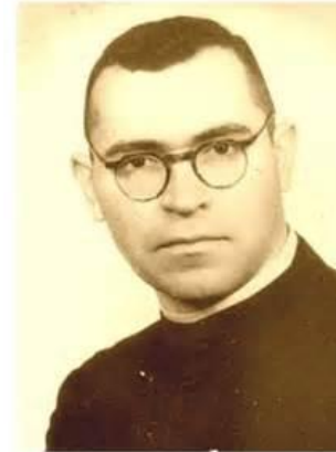
Bogdánffy Szilárd vértanú püspök