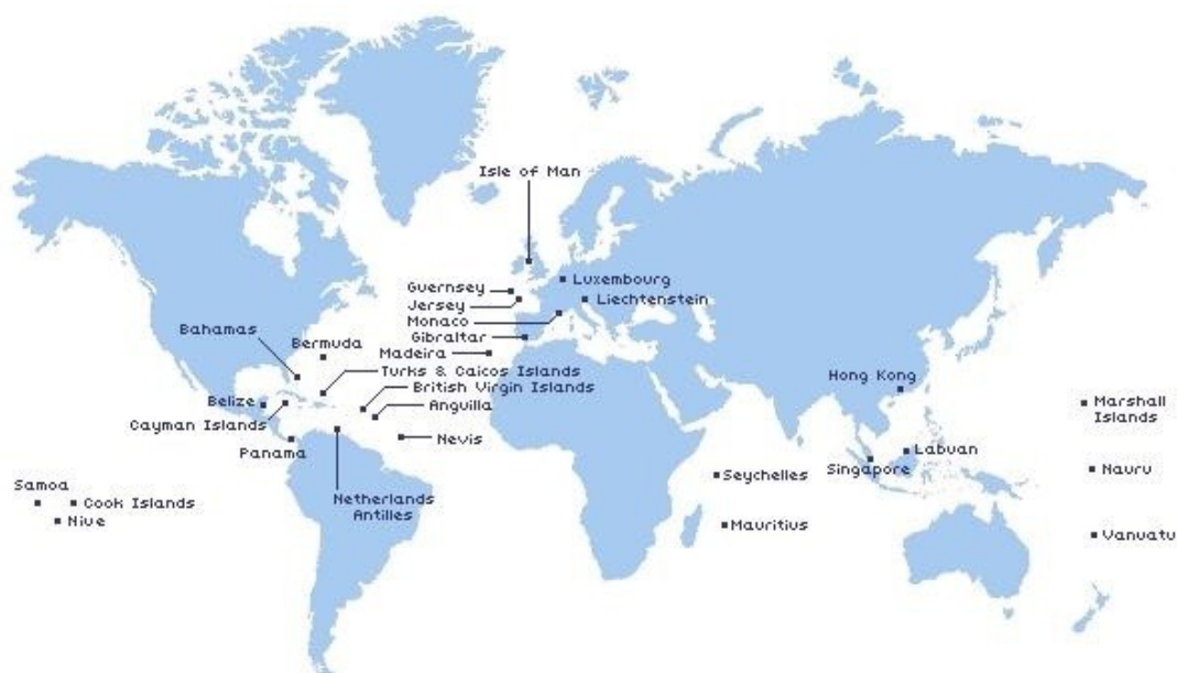
1. ábra: Adóparadicsomnak számító országok

jogi kiskapukat kihasználva számos ország igyekszik megcsapolni a globális tőkeáramlásokat kedvező adózási és/vagy adminisztrációs feltételekkel. Ki lesz ennek a folyamatnak a kárvallottja? Azok az országok, amelyek on-shore tevékenységek adóztatásával igyekeznek a költségvetési politikájukat egyensúlyban tartani. Az off-shore tevékenységek sem feltételükből adódóan törvénytelenek, csupán kreatív adózási és könyvelési megoldásokkal olyan országokba viszik a tőke hozadékait, ahol kicsi, vagy egyáltalán nincs adófizetési kötelezettség.