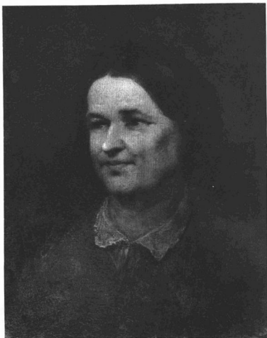
MUNKÁCSY MIHÁLY: VIDOVSZKY MAMA.