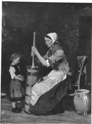
MUNKÁCSY MIHÁLY: KÖPÜLŐ ASSZONY.