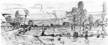
MUNKÁCSY MIHÁLY: TÁJKÉP. Tollrajz. A Szépművészeti Múzeum tulajdona.

találván ott, Zichyt kereste fel, aki szívesen igazította útbá, a Waldmüller módszere szerint.