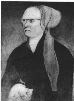
NÉMET RENAISSANCE-PESTŐ (XVI. sz.): NŐI ARCKÉP.