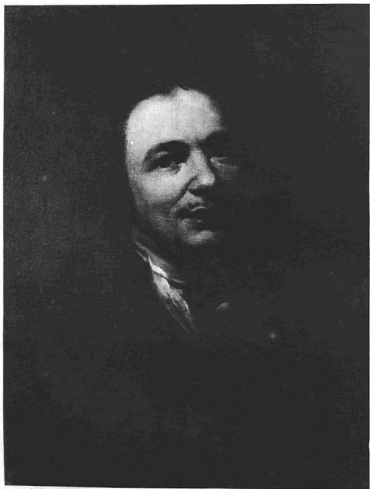
KUPETZKY JÁNOS: PÉRFIARCKÉP.