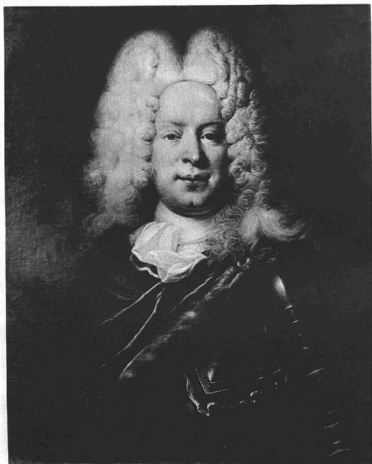
MÁNYOKY ÁDÁM: WERTHERN GYÖRGY VILMOS GRÓF ARCKÉPE.