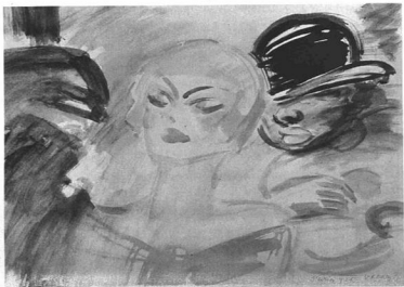
VASZARY JÁNOS: A LA CIGALE-BAN. Vízfestmény.