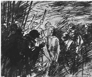
VASZARY JÁNOS: JUDÁS. 1920. Toltirajz.