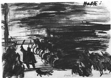
VASZARY JÁNOS: HALTE. Szénes rajz.