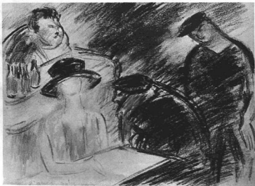
VASZARY JÁNOS: BARBAN. Színezett rajz.