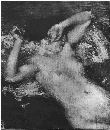
VASZARY JÁNOS: AKT. Olajfestmény.