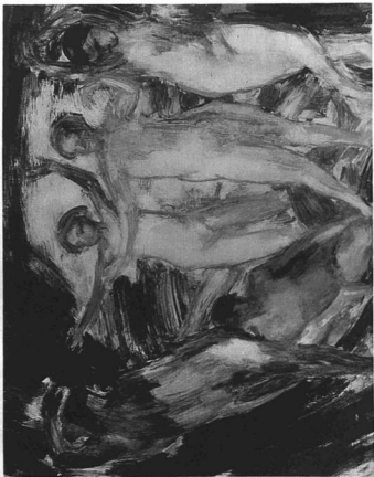
VASZARY JÁNOS: PÁRIS ÍTÉLETE. Olajfestmény.