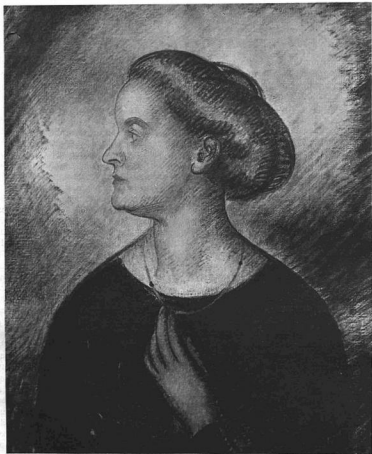
VASZARY JÁNOS: PROFIL.