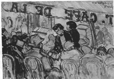
VASZARY JÁNOS: A CAFÉ DE LA PAIX TERRASZÁN. Olajfestmény.