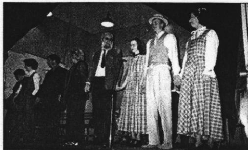
A színjátszó kör

A tavaszköszöntő dalok mellett forralt bor és tea, friss pogácsa illata töltötte meg a kies völgyet. Este a művelődési házban folytatódtak az események. A Jósvafői Színjátszó kör Seres Rezső-estjét a Jósva-kvintett népdal átírásai követték, majd a település lakóinak jelmezgyűjtéseit mérhette össze a jókedvű közönség. Oszatlan sikert arattak a „Jósvafői szüzek”, a barlangi mentőbrigád, Harry Potter és számos, eddig nem látott jelmez. A Treff Zenekar kitűnő zenéjére hajnalig ropták a táncot a vendégek. Ez az év jól kezdődött!