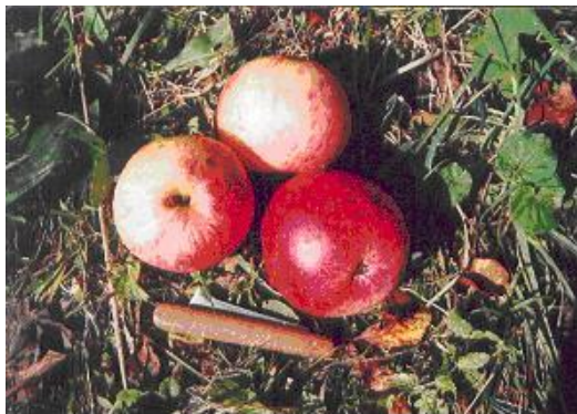
Az asztraháni piros gyümölcse