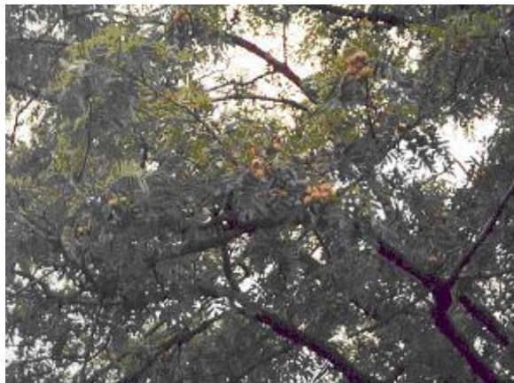
Az „uszkurusz” meglehetősen ritka gyümölcsféle

A felsoroltakon túl a művelt gyümölcsösökben a vadon termő gyümölcsök közül rendszeresen előfordul még a mogyoró, a húsos som és a vadkörte, mely gyümölcsfákat a gazdák az eredeti, irtás előtti növényzet maradványaként hagytak vissza, vagy ültettek be.