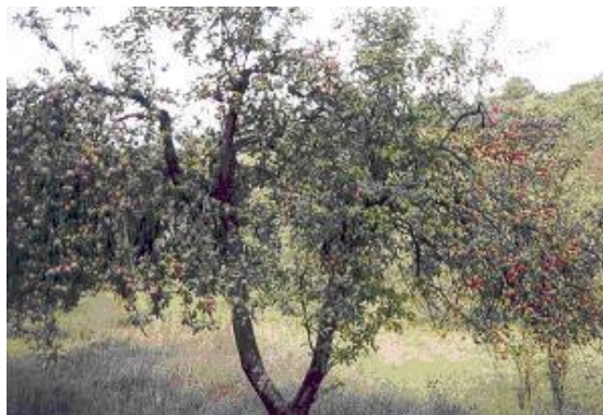
Sóvári és Jonathán kombifa

A pótlás és ültetés részben lehetőséget adott a gyümölcsös új fajtákkal való bővítésére, de a gazdák a sarancok, illetve magoncok oltása mellett úgy is gazdagították kertjeiket, hogy már ott lévő idősebb fákra oltottak más fajtát is, időben így jóval megelőzték a ma divatos ún. kombifákat.