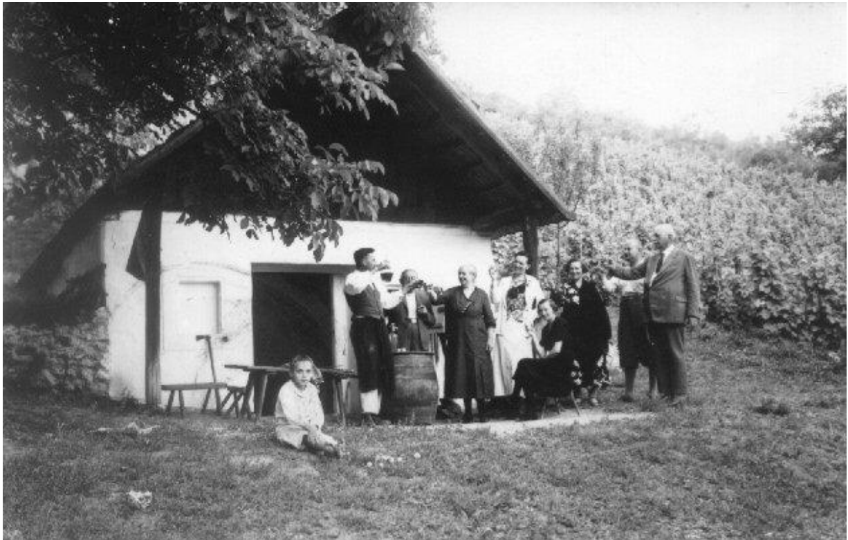
Szőlőhegy a múlt század harmincas éveiben