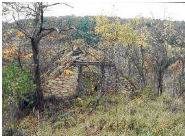
Romos, szebb napokat látott pince

A délies oldalakon régebben nagy területen álltak gyümölcsfákkal tarkított szőlők (ma helyükön jórészt száraz, cserjésedő gyepek terülnek el), a völgyaljakban és az északias oldalakon pedig gyümölcsösök terülnek el.