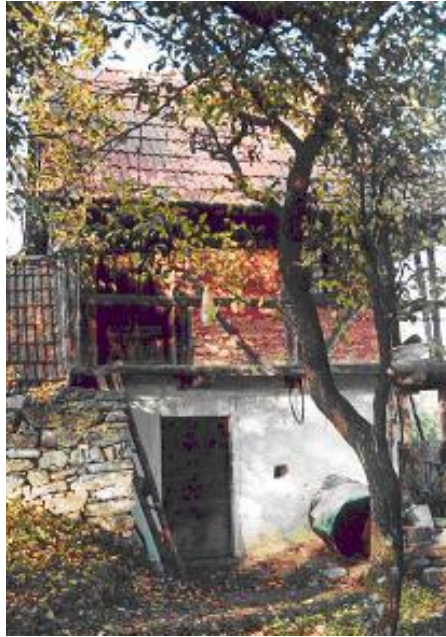
Pince és présház a jósvafői Szőlő-hegyen

A gyümölcsstermesztés klasszikus helyszíne Jósvafőn a Szőlő-hegy. A Jósvavölgytől északra elhelyezkedő hegytetők, valamint a keleti, délkeleti és déli irányban lefutó völgyek lejtői a karsztvidék viszonylatában kedvező feltételeket biztosítottak a szőlő- és gyümölcskultúra kibontakozásához.