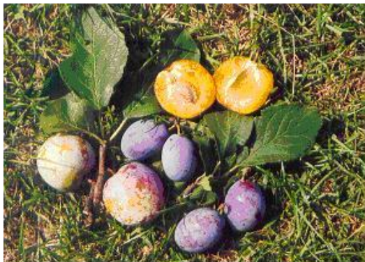
Szilvafélék a jósvafői gyümölcsösökből

mindenhol Közép- és Dél-Európában. Gyümölcse közepes méretű, oldalról kevésbé vagy erősebben lapított, hamvaskék. Húsa rendkívül zamatos, éretten aranyárga, magvaváló, így aszalásra kiválóan alkalmas. Rendszeresen és bőven terem. A fajtakörből az „alaptípus” mellett előfordul a szintén hamvaskék gyümölcsű korai és muskotályos besztercei szilva , valamint a sivákló is.