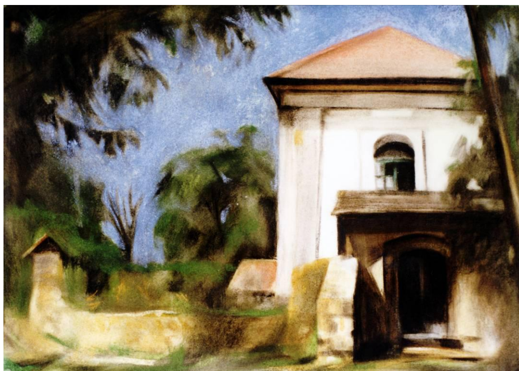
Református templom 1999