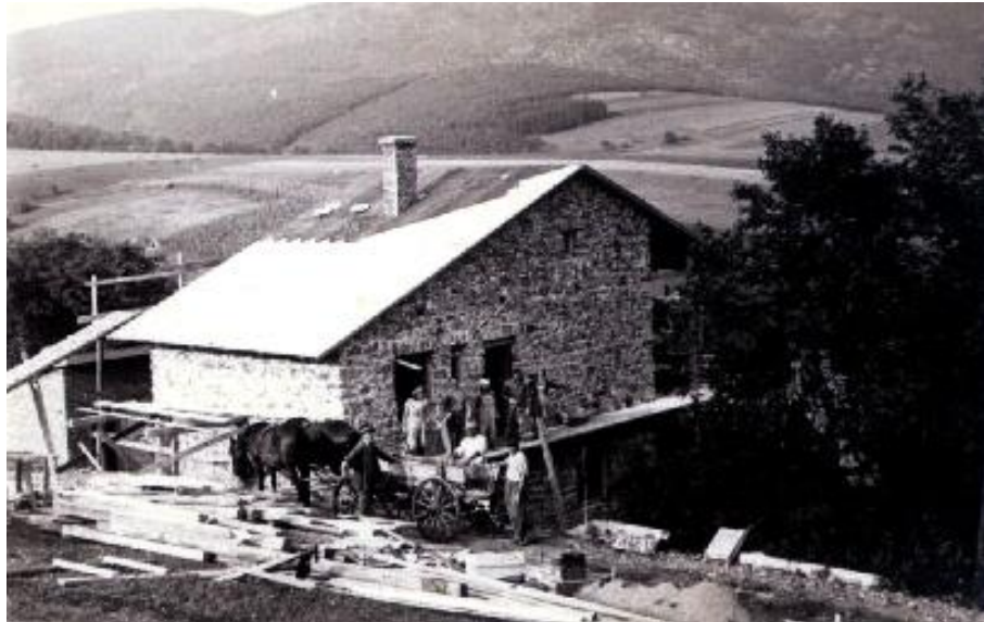
A Kutatóállomás építésének befejezése előtt (1957)

(részlet a készülő ház- és családtörténeti könyvből)