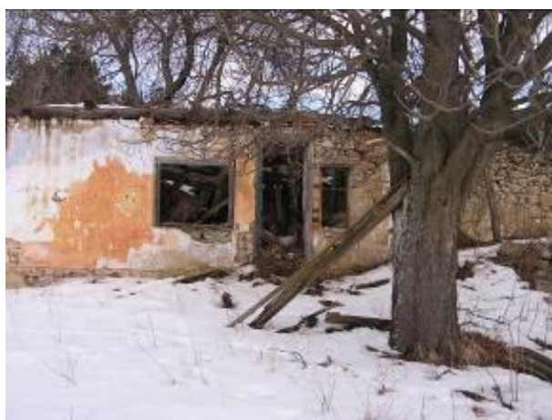
A haragistyai erdészházból sajnos mára csak ez maradt