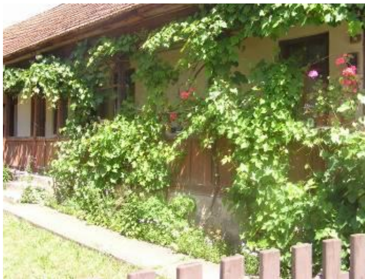
Szőlővel felfuttatott tornác, előtte virágskert

A falu utcáit járva, a kerteket és Jósvafő köztereit nézve számos tennivaló fogalmazódott meg bennem. A legfontosabb természetesen a hagyományaink feltárása és leírása, mielőtt teljesen a feledés homályába merülnének. Ezzel viszont nem elégedhetünk meg, főként akkor, ha olyan tradícióról van szó, amelynek felélesztése, vagy inkább alkalmazása nem igényel mást, mint akaratot és jó szándékot.