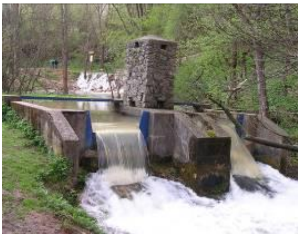
A Nagy-Tohonya bukógátján átzú- duló víztömeg (2005)