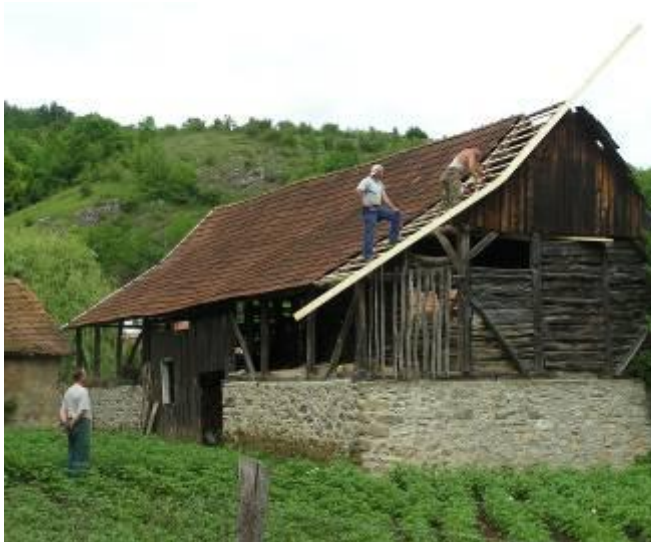
Csúrtető felújítás polgármesteri felügye- lettel