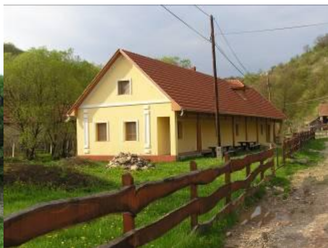
A „Pásztorház” új köntösben