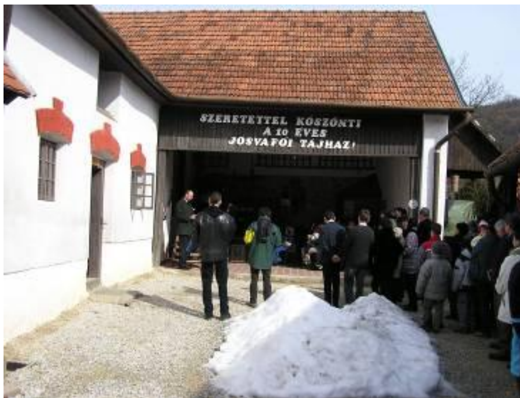
Március 15-i megemlékezés a tájházban 2005-ben