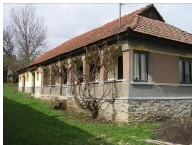
Itt a tervek szerint tájház nyílik