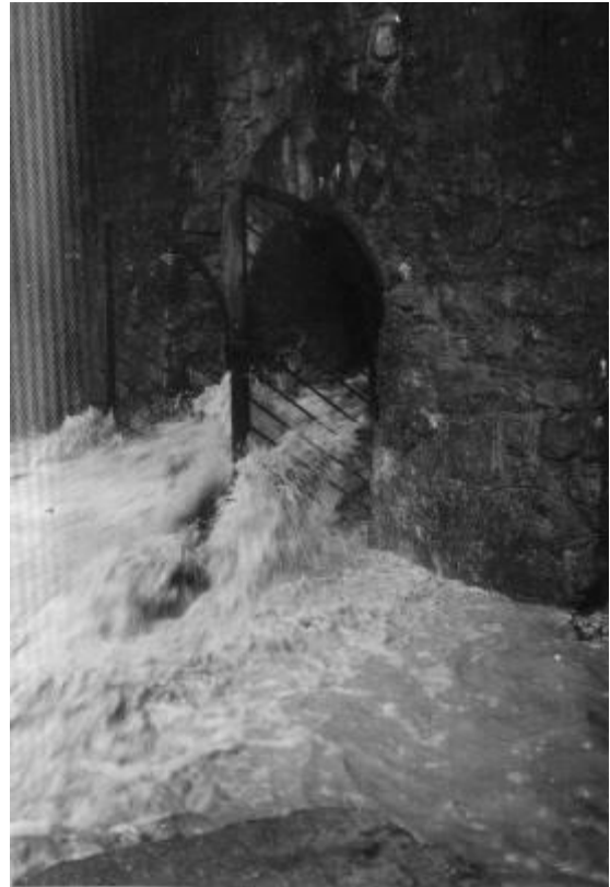
A Rövid-Alsó-barlang bejárata 1981-ben