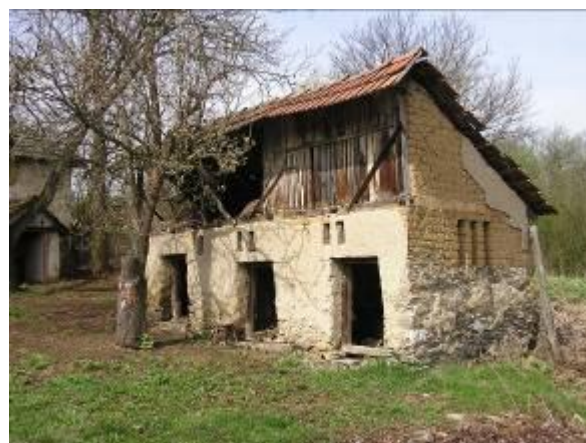
Szerencsére a porta melléképületei is megmaradtak, bemutathatók