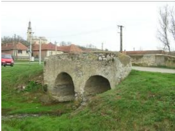
Az abodi kőhíd, háttérben a görög-keleti templom