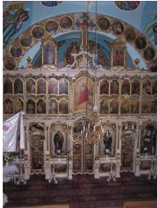
A görög-keleti templom ikonosztáza