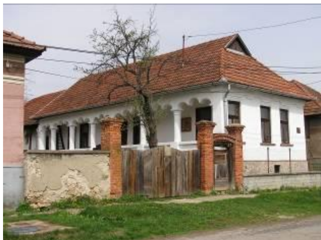
Egy szépen helyreállított porta