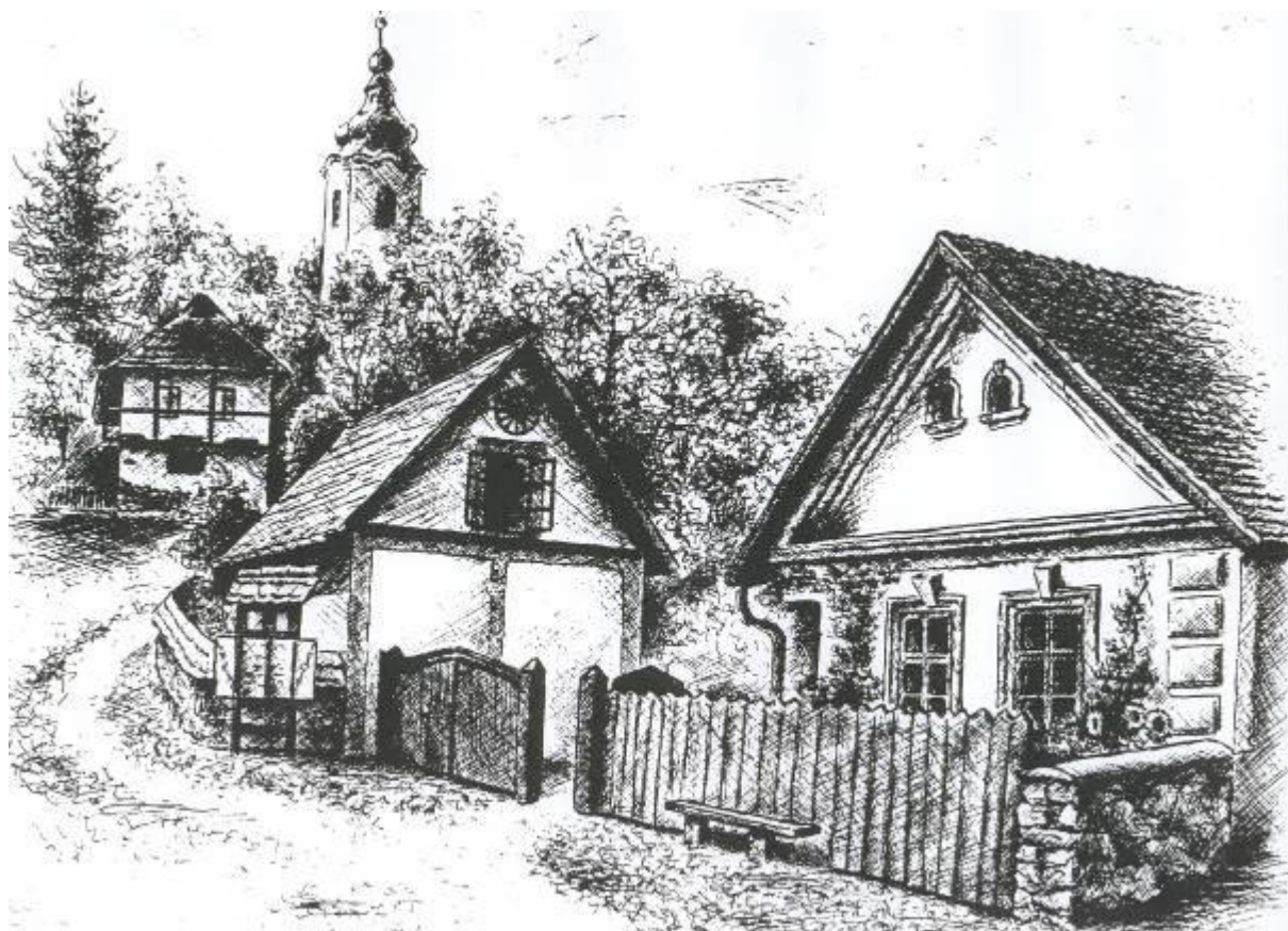
A jósvafői tájház és a harangtorony