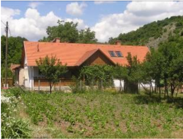
A Szmorad-porta a Táncsics utcában

Köszönet a fészekrakóknak és múlt emlékei ápolóinak!