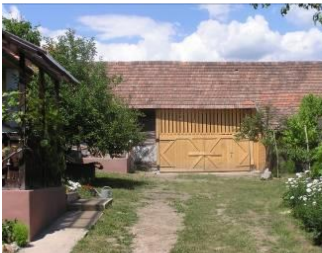
Schág Dánielék megújult csűrje a Tán- csics utcában