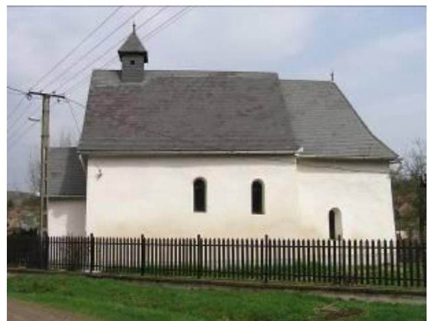
A református templom