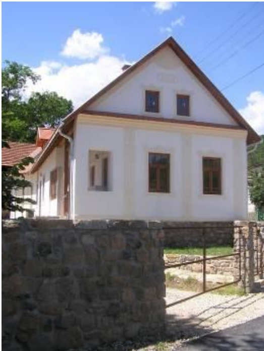
Dózsa György utca 1. a Berecz-porta