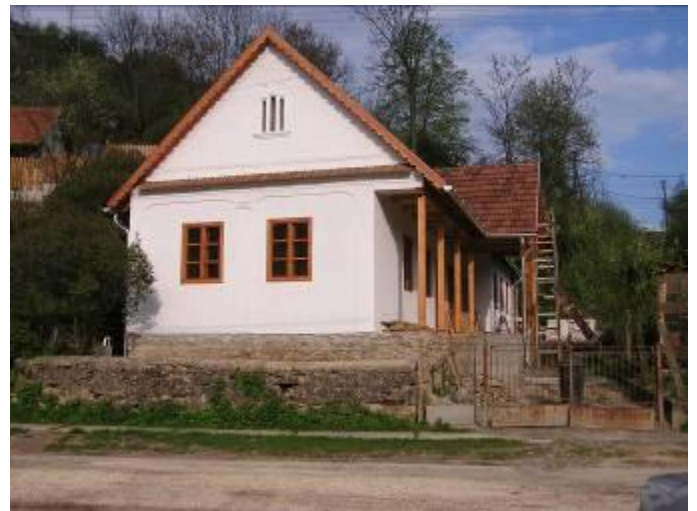
A Visnyovszky-porta a Kossuth utca sarkán