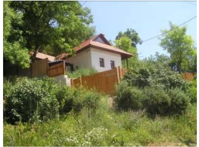
A „Holland” háza