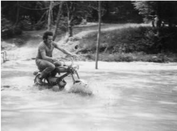
Tavaszi árvíz 1981-ben