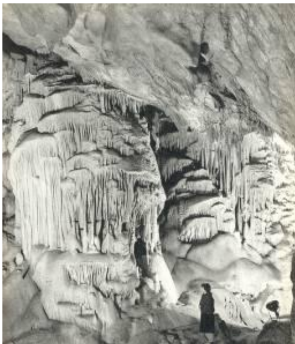
Részlet a Domicabarlangból