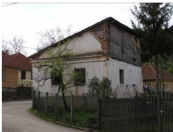
Ennek a szép kis háznak legalább a tetőszerkezetét helyre kéne állítani