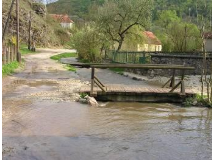
A Rákóczi utca vége 2005 tavaszán