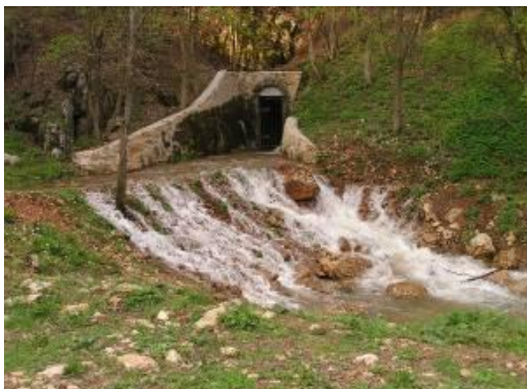
A Kossuth-barlang táróján kiömlő Nagy-Tohonya forrás 2005 tavaszán