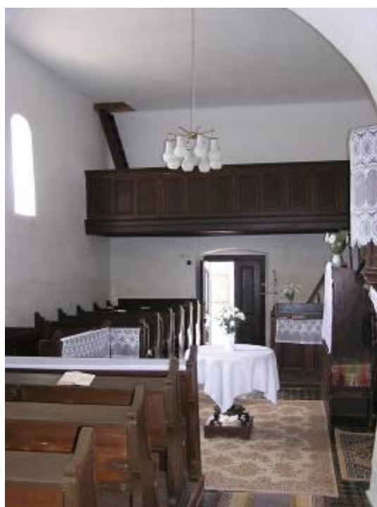
A református templom belső tere, középen az öntöttvas lábú Úr asz- talával