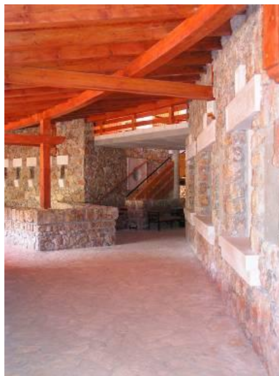
Az építményben a természetes anyagok dominálnak