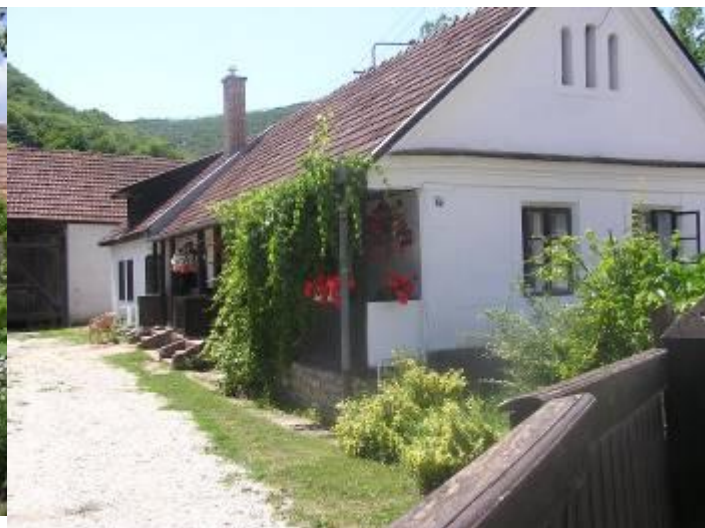
Antal Bácsi hajdani portáját a Nemzeti Park újította fel