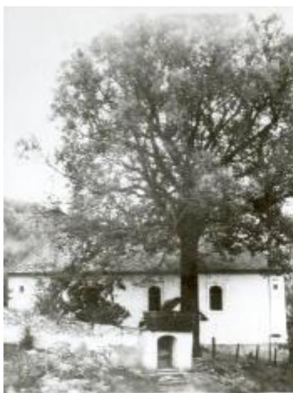
A hársfa a múlt század 70-es éveiben