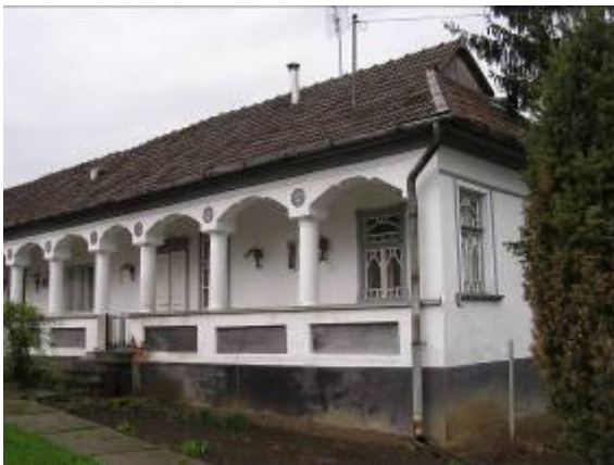
Védelemre érdemes lakóház Abodon