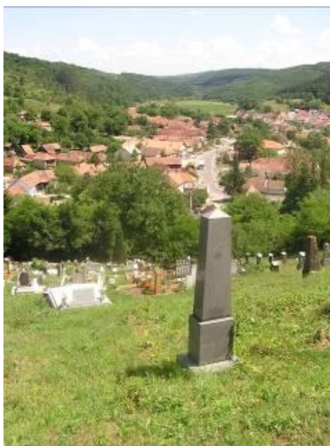
Idrányi Lajos síremléke a jósvafői temetőben

A Múzeumok Majálisa ez évi rendezvényén egy kedves hölgy lapozgatta a Tájházsövetség standján kirakott Jósvafő monográfiánkat, majd beszélgetésbe elegyedtünk. Elmondta, hogy Idrányi Lajos, hajdani jósvafői lelkész leszármazottai, és azt is elmesélte, hogy komoly kutatásokat végeztek felmenőike-ről. Kértem, hogy az Idrányi Lajosra vonatkozó ismereteiket, anyagaikat küldje meg nekem, hogy a Helytörténeti Füzetekben közreadhassam. A májusi rendezvény óta már eltelt két hónap, kezdtem lemondani az anyagról. Azután június végén Dr. Olajos Pálné kedves levele társaságában megérkezett az összegyűjtött anyagok másolata, némi értelmező magyarázatokkal. Köszönet érte! Ezeket most változatlan formában közreadjuk: