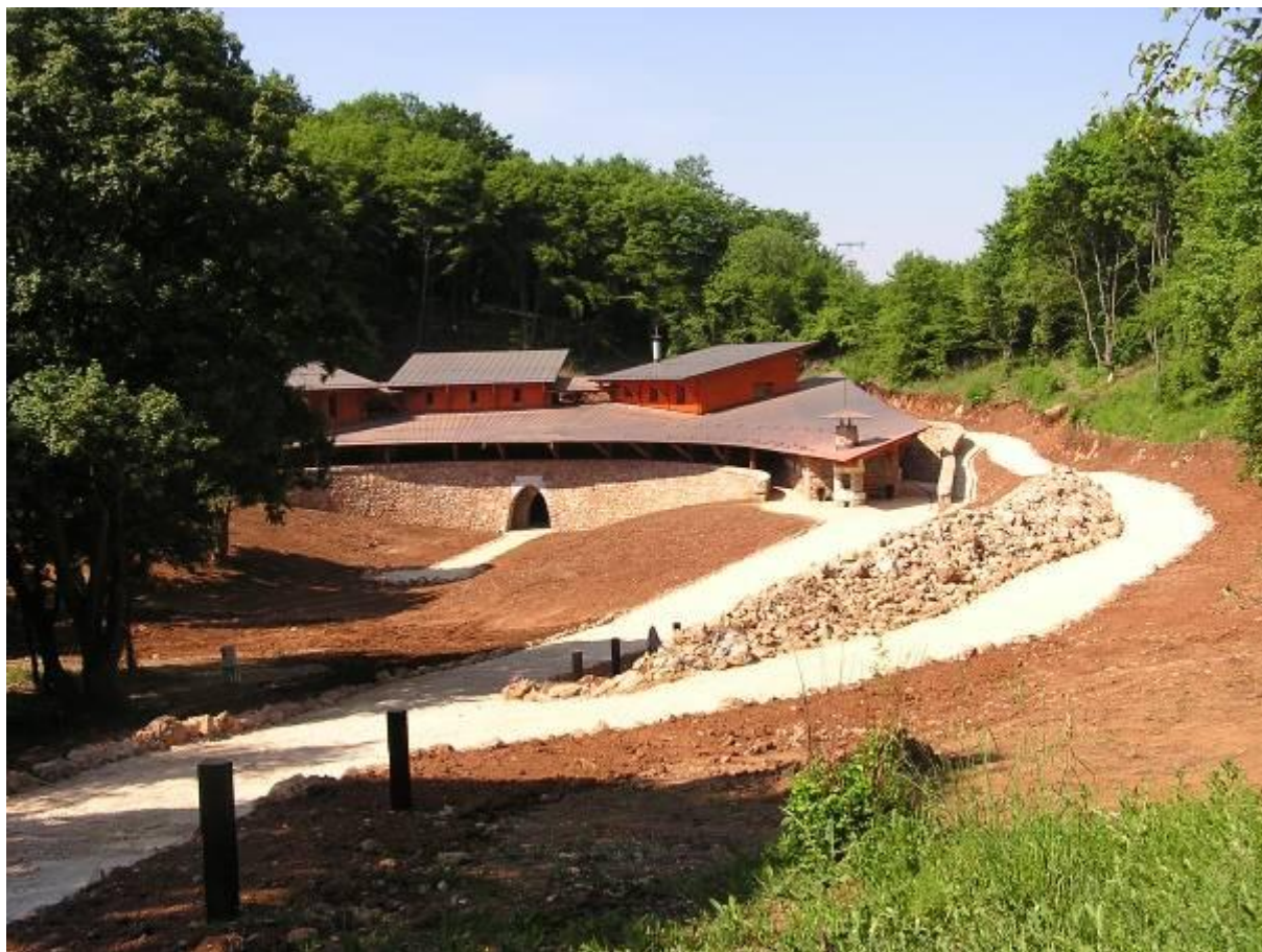
Az új Vörös-tói fogadóépület

Ebből az alkalomból jelent meg az Élet és Tudomány c. folyóiratban (2005. 28. szám; LX. évf., 2005. július) az alábbi cikk: