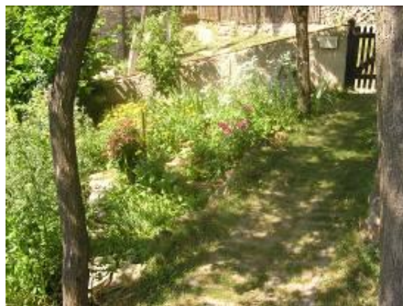
Részlet a tájház virágoskertjéből