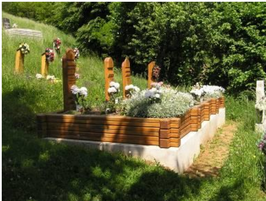
A jósvafői temetőbe örömeinkre visszatérnek a fából készült sírjelek, síremlékek

Felhasznált irodalom. Néprajzi Lexikon Szüleim elmondása